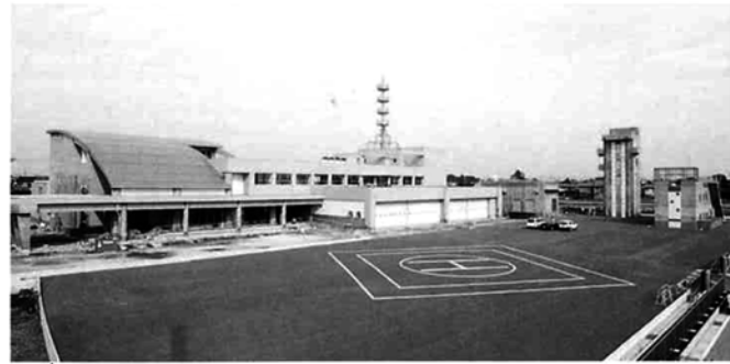
3月1日から業務を開始する新消防庁舎

寺泊町・吉田町・分水町・岩室村・弥彦村の5町村で構成する新潟県西部広域消防事務組合では、平成8年度から吉田町大字浜首地内で建設を進めてきた新消防庁舎が今春完成します。新庁舎での業務開始は3月1日からです。