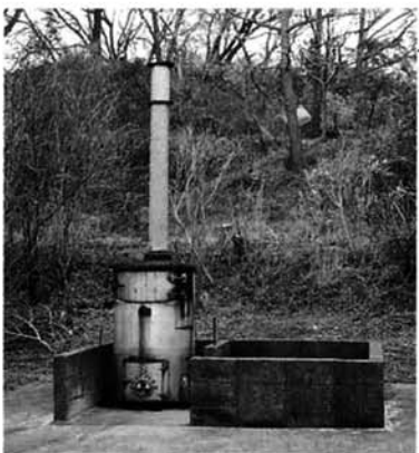
使用廃止された役場焼却炉