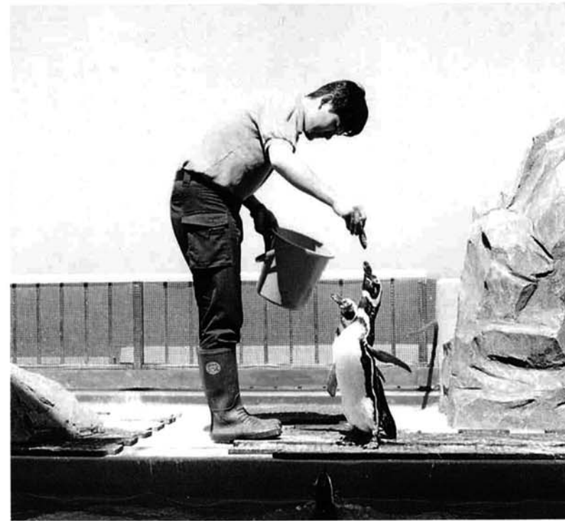
↑ペンギンの食事のようす

前回から始めた水族博物館の裏側探検では、水族博物館で水中生物に与えている餌の種類などについて紹介しましたが、今回は餌の与え方(給餌)について紹介します。 魚などの水中生物に餌を与えることは、簡単なように思えるかもしれませんが、飼育係にとってはとても大切な仕事です。基本的に一日一回(小