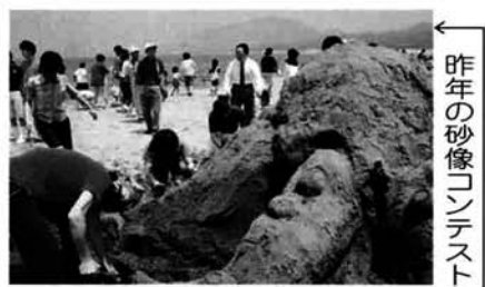
昨年の砂像コンテスト

夏の観光シーズンを前に恒例の「海開き」を開催！ 今年、各種イベント開催前に海岸清掃をおこないます。「砂像コンテスト」「アサリとり大会」など盛り沢山の内容ですので、家族連れ、友達同士での参加をお待ちいたします。