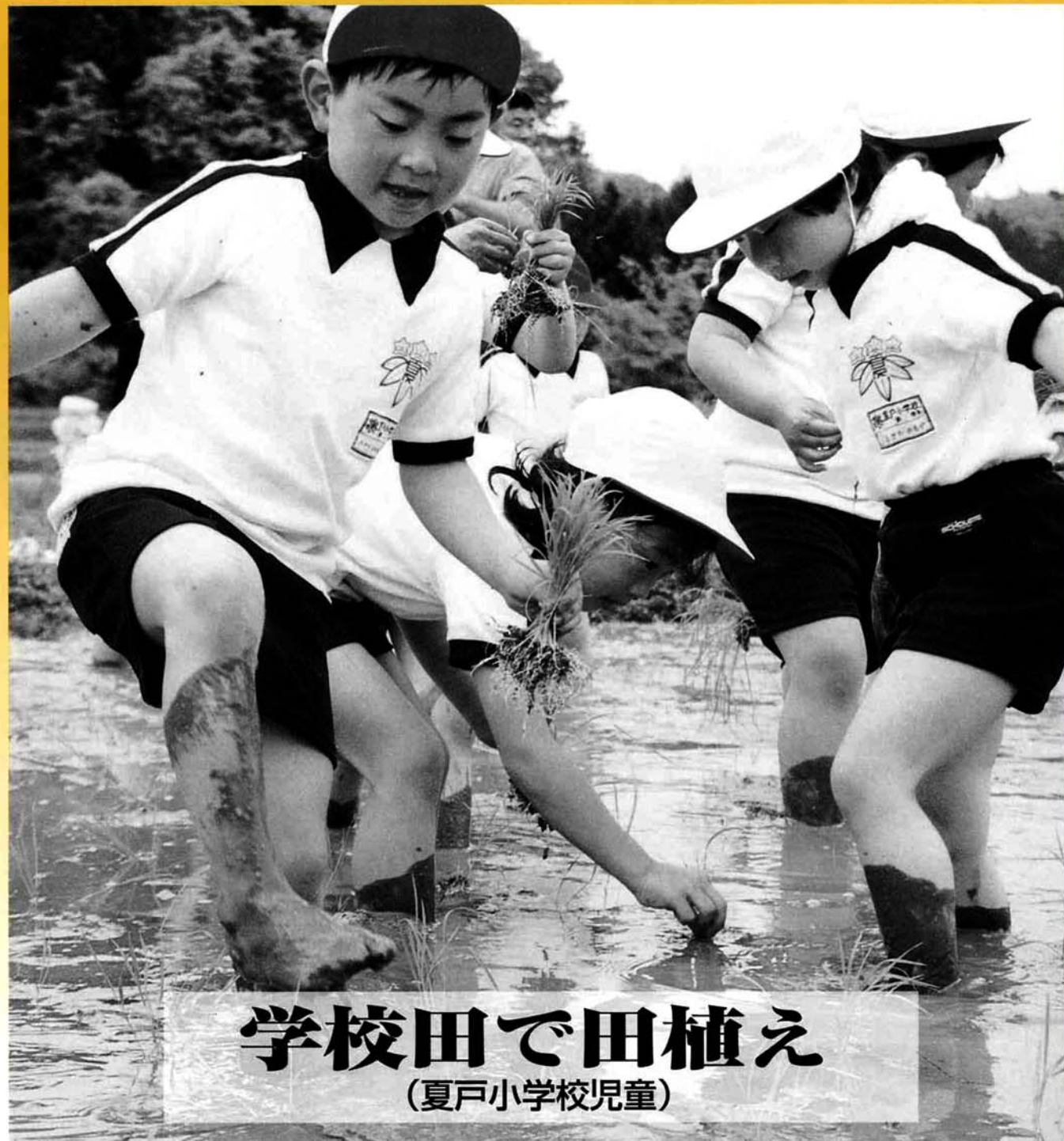
学校田で田植え (夏戸小学校児童)