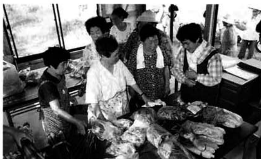
新鮮な野菜がいっぱい

今年も、多くの消費者からより長く支持される直売所を目指し、三古農業改良普及センターの指導で栽培指導会の開催等準備し、生産者の「あちゃん・ばあちゃん」たちが、大勢の皆さんをお待ちしています。