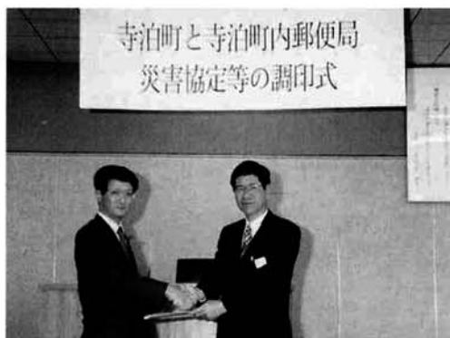
協定締結の固い握手

下水道のマンホールの蓋のデザインが決まりました。カニ・タコ・イカなどが描かれた蓋は、文化センター「はまなす」に展示してありますのでご覧ください。 平成10年度下水道工事は、昨年度に引き続き磯町地内までの町道と、国道の歩道内の約1.3kmの管渠埋設工事を予定しております。