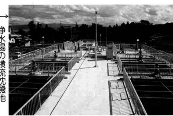
浄水場の横流沈澱池

生活の利便性と反比例し、全国的に河川の汚濁が深刻化してきていることに伴い、平成5年に水道の一層の安全性と信頼性を確保するため、水道法の水質基準が大幅に改正されました。町ではこの基準に従い、毎月47項目にも及ぶ水質検査を行っています。平成9年度実施検査の平均値をお知らせいたしますが、各項目とも基準値内で「安全な水」であることが確認されています。