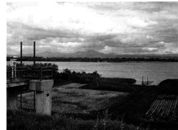
信濃川からの取水口

私たちの生活や産業に一日も欠かすことのできない水道水。不自由なく、あたりまえのように使っていますが、水道水は決して無限ではありません。6月1日から一週間は「水道週間」です。この機会にあ