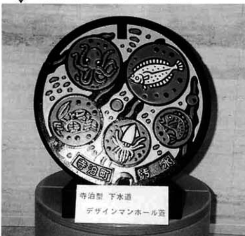
寺泊型 下水道 デザインマンホール蓋