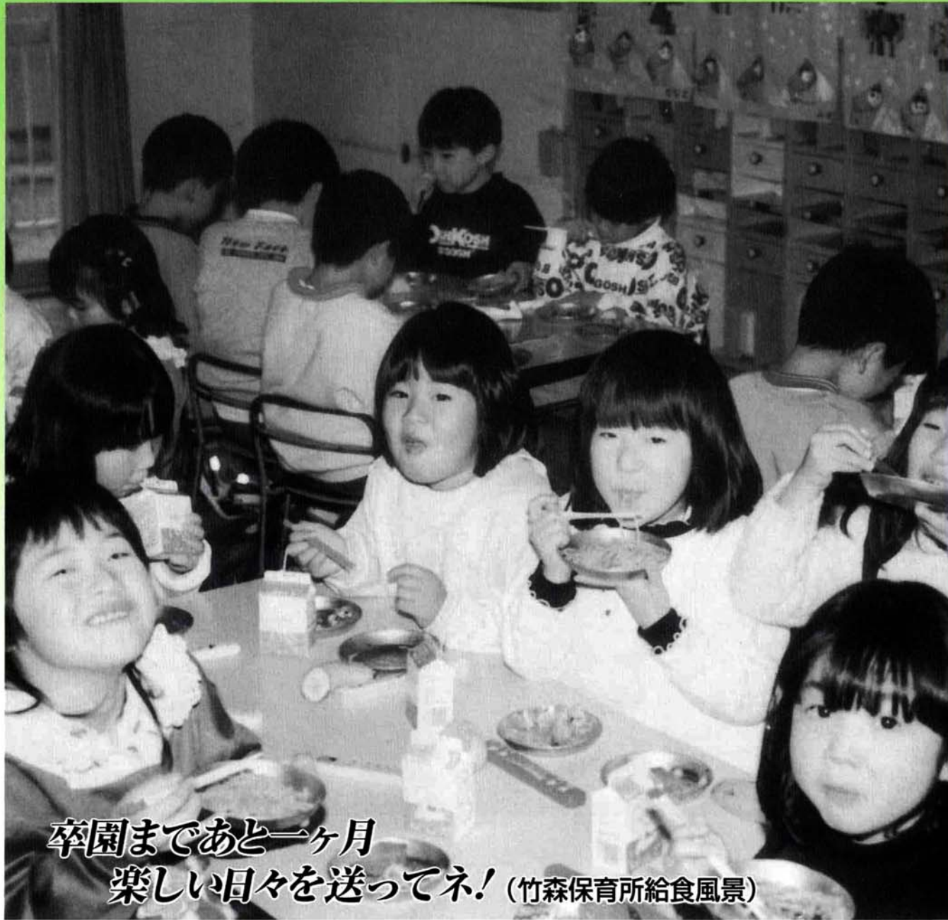
卒園まであと一ヶ月 楽しい日々を送ってネ! (竹森保育所給食風景)