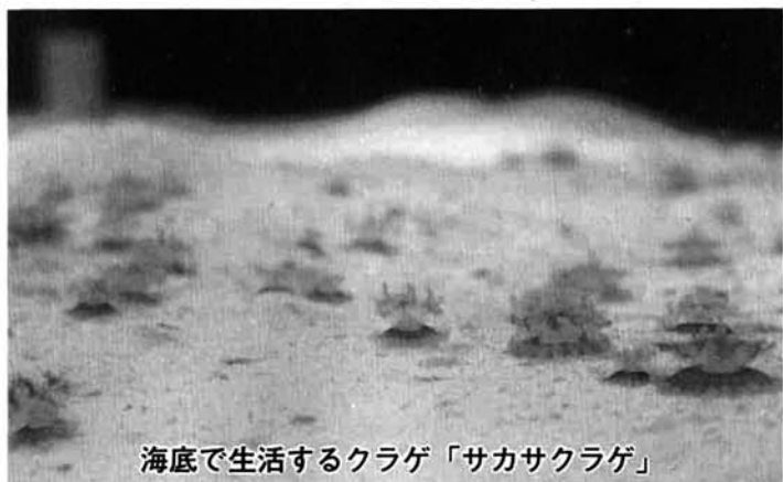
海底で生活するクラゲ「サカサクラゲ」

一般に海中を漂いながら生活する腔腸動物の一群をクラゲと呼んでいますが、クラゲはカツオノエボシ（電気クラゲ）やアンドロクラゲに代表されるように、海水浴の時に人に毒針で刺し害を与えるため嫌われている生物です。