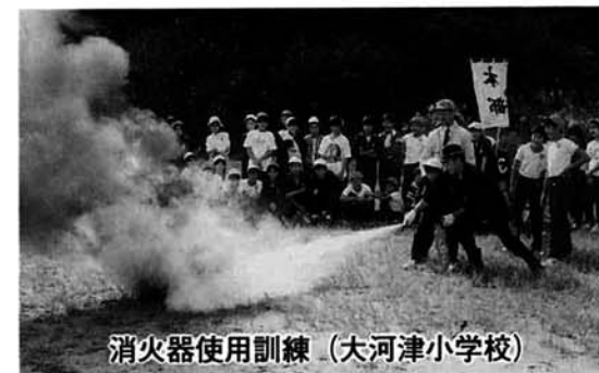
消火器使用訓練(大河津小学校)

全国一斉に11月9日から11月15日まで実施される期間中、地区や事業所・各施設などで各種の消防訓練を実施します。