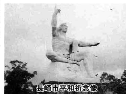
長崎市平和祈念像

いたしました。 心配された台風も、現地では、小雨がぱらつくくらいで通り過ぎむしろ、新潟の方の心配が大きかったとのことでした。 二年生が修学旅行に行っている間の九月三十日、一年生