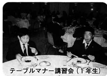
テーブルマナー講習会(1年生)