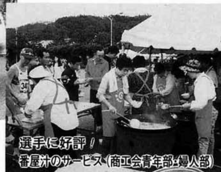
選手に好評! 番屋汁のサービス(商工会青年部・婦人部)

10月16日、薄日のもれる絶好のマラソン日和の中「第16回寺泊シーサイドマラソン大会」が盛大に開催されました。