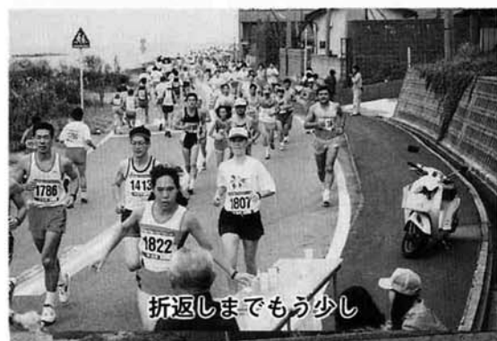
折返しまでもう少し