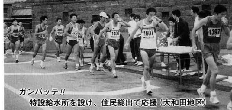
ガンバッテ!! 特設給水所を設け、住民総出で応援(大和田地区)