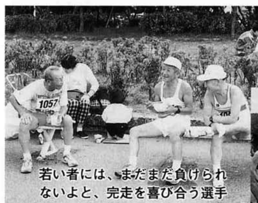
若い者には、まだまだ負けられないよと、完走を喜び合う選手