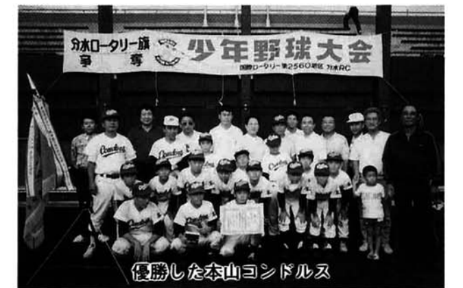
優勝した本山コンドルス

この両大会をとおし、指導者も選手も来年の活躍をうらなう意味で大きな収穫となり、益々「寺泊健児」の活躍が期待されます。