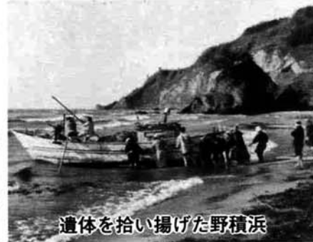
遺体を拾い揚げた野積浜

に落下したという。(北越奇談) 同じ頃、所用で寺泊の円福寺へ来ていた在の人が夕方帰ろうとしたら、俄雨で小川が溢れて渡ることができない。そこで円福寺墓地から大きな角塔婆を抜き取り、橋代わりにして渡った。翌日も円福寺に用があり夕方帰る時に小川にかけたままの塔婆を元の所に戻そうとしたが場所がわからない。辺りは暗くなり薄気味悪くなったので「塔婆を納める場所はどこじゃ」と叫ぶと数メートル先から青い火が飛んだ。恐る恐るその場所へ近寄ると、そこは埋葬したばかりの土饅頭であった。(北越奇談) 円上寺湯干拓