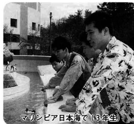
マリンピア日本海で(3年生)

九月二十八日、「大型で非常に強い台風二十六号が、九州地方に接近中」との予報の中、その台風目指して我々の乗った飛行機は飛び立ちました。 今年度から県立高校の修学旅行で航空機使用が認められるようになり、いち早く本校でも取り入れました。 生徒はもちろん、引率の先生がたの中でも飛行機に初めて乗る者もいて、不安があったと思いますが、無事大きな成果を挙げて終了