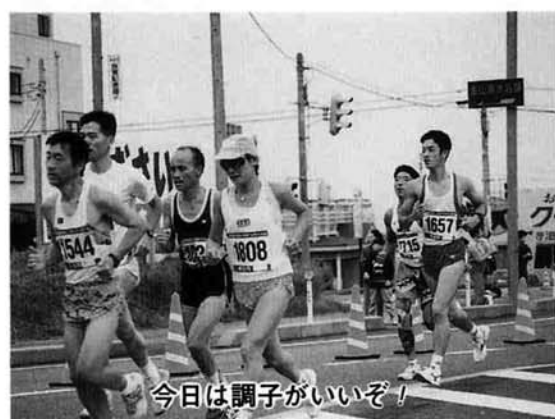
今日は調子がいいぞ!