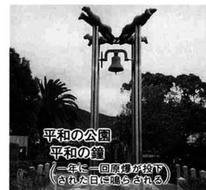
平和の公園 平和の鐘