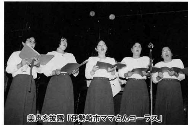
美声を披露「伊勢崎市ママさんコーラス」

8月23日野積海水浴場海岸の特設会場で日本海夕日ラインサマーフェスティバル'92が盛大に開催されました。イベントステージでは、分水太鼓、野積地区の盆踊りなどの郷土芸能祭、CDプレイヤーが当たるジャンケングランプリ、友好親善都市伊勢崎市から「伊勢崎市ママさんコーラス」が参加、美声を披露してくれました。ちびっこコーナーでは、金魚すくいなどいろいろなゲームが全部無料とあって押すな押すなの賑いでした。お訪れた人達は、思考をこらしたイベントと、そしてすばらしい夕日を楽しんでいました。