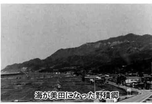
海が美田になった野積郷

一方、弥彦山の西南山麓にある西生寺は、天平三三三三年に行基が開基し、平安期の久安元（二四五年）、奈良興福寺の僧主が建立したと伝えらるる真言宗の古刹である。文永五（二六八年）三月十二日付「恵信尼（親鸞の妻）消息」に聖人が「のづみと申す山寺に不断念仏を始め候」とあり、親鸞聖人に關する境内の大録杏の伝承もここに由来したと思われる。