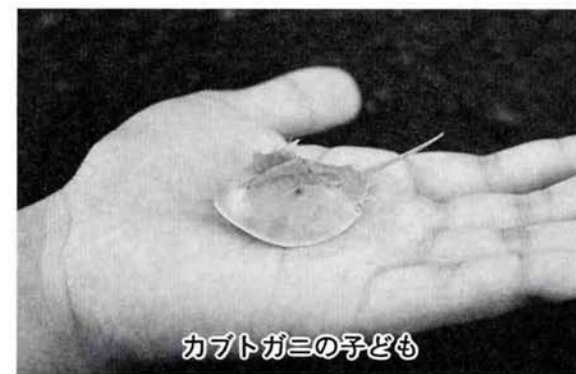
カブトガニの子ども

るにすぎません。近年は干拓や海洋汚染の影響で、その数が少なくなってきたいます。また岡山県笠岡市では繁殖地が天然記念物に指定されていて、カブトガニが保護されています。 日本では七月から九月にかけてメスは砂の中に数百個の卵を産卵します。卵は三mmほどで、ふ化後の幼生は古生代の海の生物、三葉虫によく似ている三葉虫型幼生で全長六mmほどです。親と違ってまだ長い剣状の尾はなく、脱皮をしながら成長し、約十五年ほどで、全長六〇cmほどの親になるといわれています。 新しく仲間入りしたカブトガニの子どもたちは約三歳位のカブトガニだと思われます。現在はアサ