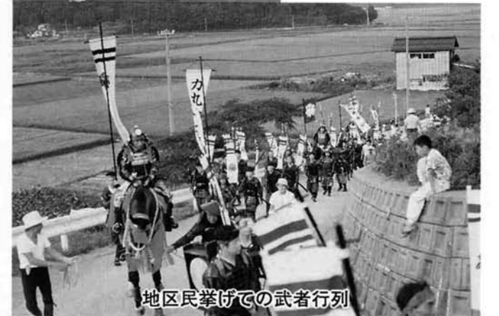
地区民挙げての武者行列