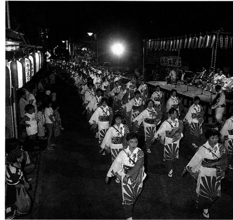
大民謡流しに町民総参加