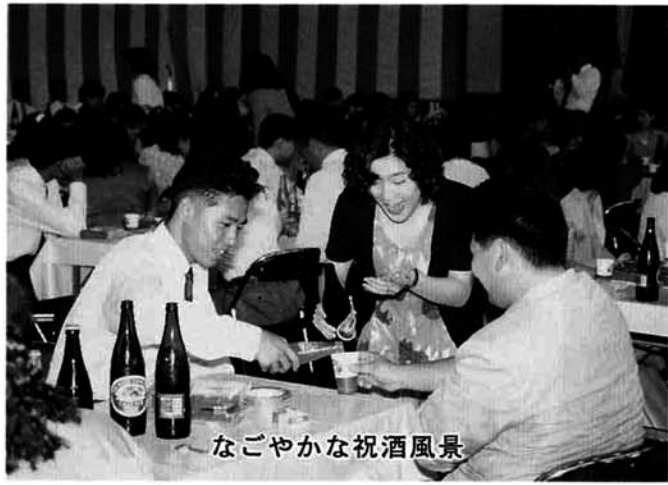
なごやかな祝酒風景