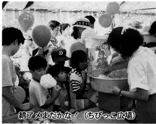
綿アメまだかな！（ちびっこ広場）