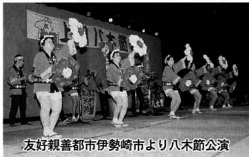
友好親善都市伊勢崎市より八木節公演