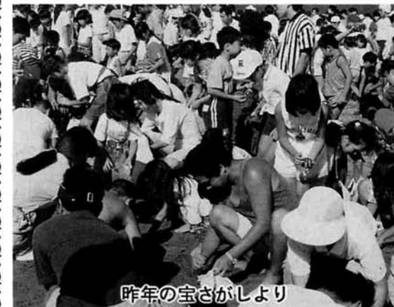
昨年の宝さがしより