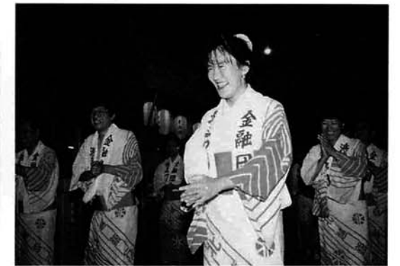
ひとつでポン！ うまく踊れた