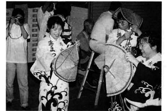
もうひとがんばり