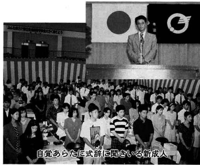
自覚あらたに式辞に聞き入る新成人