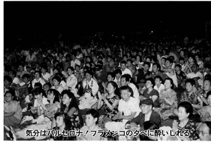
気分はバルセロナ！フラメンコの夕べに酔いしれる