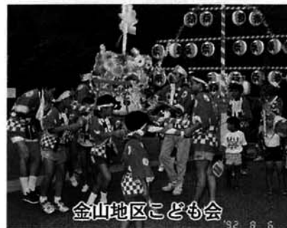
金山地区こども会