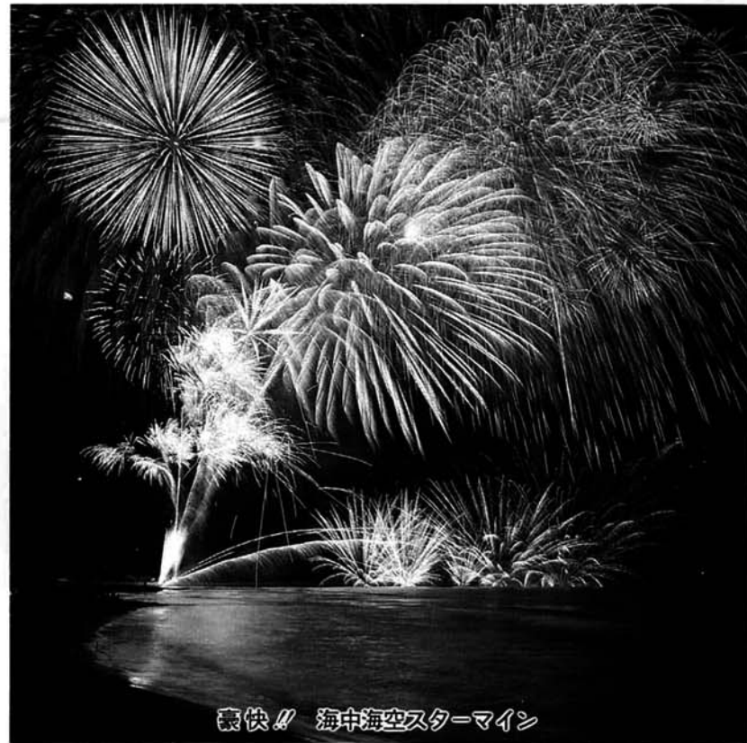
爽快！！ 海中海空スターマイン