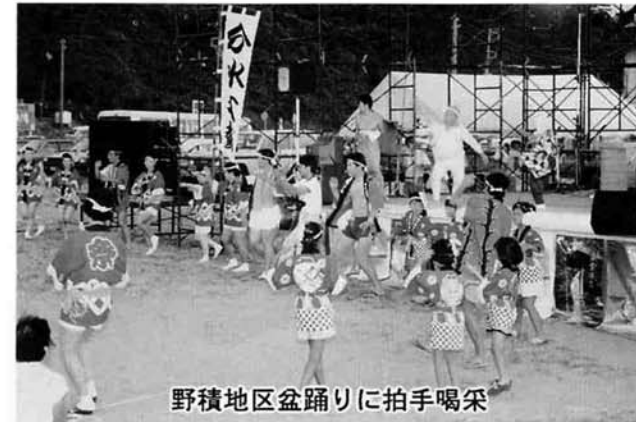
野積地区盆踊りに拍手喝采