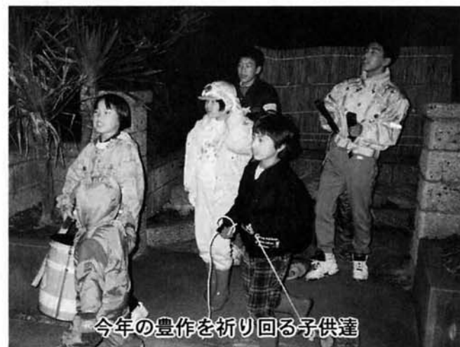
今年の豊作を祈り回る子供達

豊作を祈り、モグラを追い払うモグラモチ行事は以前、町内各地の集落で行われていましたが今日では、あまり見られなくなりました。そんな中で郷本(七ツ石)地区の子供達、青年の方が昔ながらの伝統行事を守り育っています。 この「モグラモチ行事」は一月四日夜、地区の子供達と青年の方約二〇名が今年、一回り番の家にあつまり、懇親と親睦を重ね、一五日午前零時、村の鎮守様に豊作、無病息災をお祈りし、「二軒の家を一軒ずつ横槌を縄で縛って、引きずりながら、又、ドラムカンをたたきながら「モグラモチはどこいった、となりのやしきへ」といって横槌どのおんまいだ、モックラホイ！モックラホイ！」と参加者全員で口上を唱えながら家を回り、今年の豊作を祈っていました。