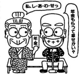
年金もついでに控除したい 私いあわせっ

農業、漁業などの自営業やサービス業を営む皆さん、確定申告の時期がやってきました。国民年金の保険料は、社会保険料控除として、課税所得額から差し引かれることになっていきます。