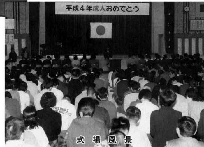
平成4年成人おめでとう