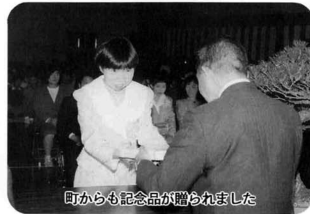
町からも記念品が贈られました