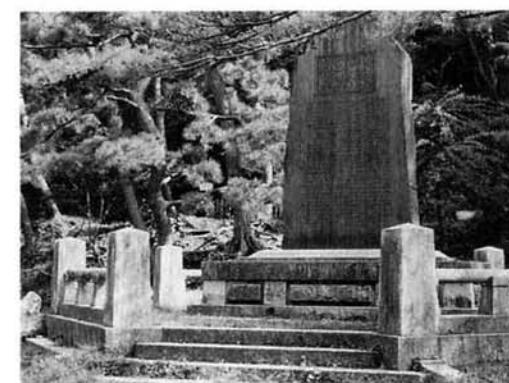
順徳上皇御遺跡碑

掲載内容 ○寺泊の気候・地勢等の自然環境 ○原始・古代の寺泊と人々の生活 ○横滝山廃寺と初期越後国府の謎 ○夏戸城主志駄氏代々の活躍状況 ○神社・寺院・仏堂の由緒・沿革 ○幕末・維新の混乱と世直し状況 ○海と街道がもたらした文化遺産