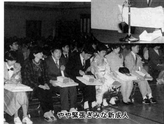
やや緊張ぎみな新成人