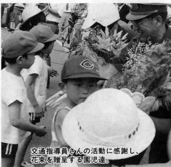
交通指導員さんの活動に感謝し、花束を贈呈する園児達。

現在、県下一斉に運動が展開されている夏の交通事故防止運動のオープニングキャンペーンとして、七月二十一日水族博物館前において県・県警・寺泊町の合同キャンペーンが行なわれました。これは近年、観光客の増加とともにこれら観光客による交通事故が増加していることから、「観光客らどまり」として、県内外に広く知られている本町を会場として、観光客による交通事故の防止を広く呼びかけようとなつたものです。当日は保育園児や小学生、交通安全関係者が多数参加され式典が行なわれた後、会場より荒町地内の寺泊幹部派出所前までパレードを行ない、街頭指導所を開設し、交通安全団体員や寺小六年生の参加により通行車輛の運転者に事故防止を呼びかけました。