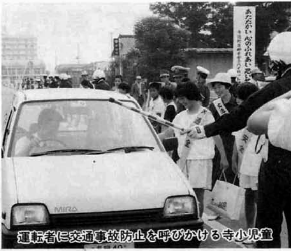
運転者に交通事故防止を呼びかける寺小児童