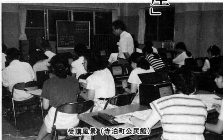
受講風景(寺泊町公民館)

(30才・会社員) 機械を聞くと頭が痛くなるのですが、とても楽しかったです。もう一度受講してみたい。 (34才・事務員) 職場での文書作成や町内会のたよりを作成する時にワープロを使用したかと思いましたが、とても楽しい講習会でしたが、もう少し時間をかけてほしいと思いました。 (39才・看護婦) この講座に参加して初め