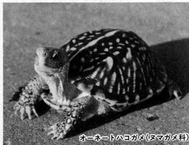
オーネートハコガメ(ヌマガメ科)

なかでも水辺の景観をあらわしたカメラフィルムには、北アメリカに生息するカミツキガメ科のワニガメは県内では初公開の巨大ガメで甲長80cm、体重80kgもあります。また南アメリカに生息するヘビクビガメ科のマタマタは首が長く、とても形のユニークなカメラです。その他、森林や草地にすむ陸ガメ科のギリシ