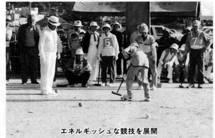
エネルギッシュな競技を展開

梅雨のとき、空が心配されましたが、当日は快晴。寺泊町の木、ニセアカシアの緑、ぬけるような青空、青い海、絶好のコンディションの中で、白熱した戦いが展開されました。順位は次の通りです。