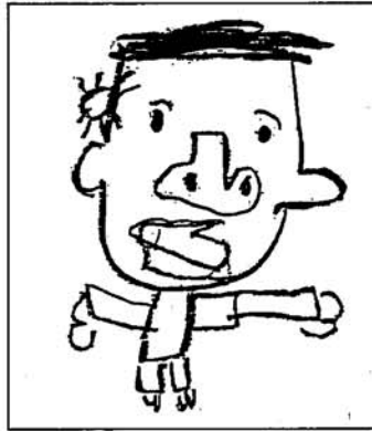
おおきくなったボク