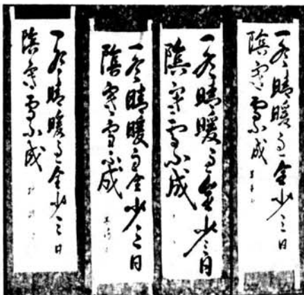
書道教室二月の作品 一冬晴暖雨全少 三日陰寒雪下成

○スポーツ障害保険のご案内 加入希望のグループ、サークルなどは早目に申出ください。 氏名、年齢、性別、職業（ハッキリと）代表者の印鑑、保険料（一人千円）を添えて教育委員会へ。 本年度から保険料が改定されました。 ○野球協会チーム登録は 昭和58年度 三月三十一日までに 野球協会の活動につきましてご理解・ご協力をいただき感謝申し上げます。 野球協会の加入については規約により三月三十一日までに登録することになっております。新たに加入を希望されるチームはもちろんのこと、現在加入されているチームも登録が必要ですので忘れずにお願いたします。 登録用紙など詳しいことは野球協会事務局へ（役場内☎三一一一）