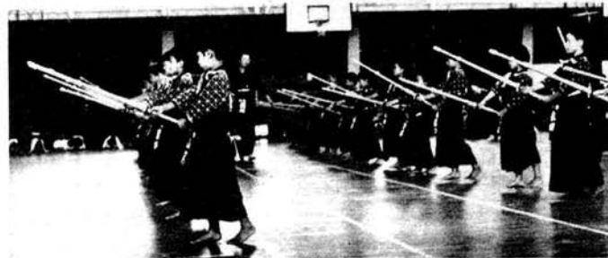
6月26~27日少年剣道教室では、小国中寄宿舎を利用して強化合宿を行いました。