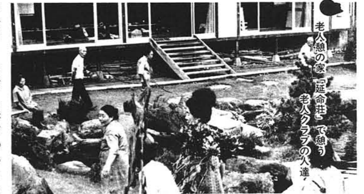
老人憩の家「延命荘」で遊ぶ老人クラブの人達

は全国で約66万人にのぼると推定されています。 年金制度・老人医療の無料化・住宅問題・福祉サービスなど、社会保障の充実を図るとともに、老後をいかに生きるかという面にも目をむける時を迎えているといえましょう。「生きがい対策」がより重要な意味をもってくるのです。 この問題はお年寄り本人の課題であることはもちろんですが、周囲の人たちもお年寄りの生きがいについて、アドバイスをしたり、相談にのってあげてください。