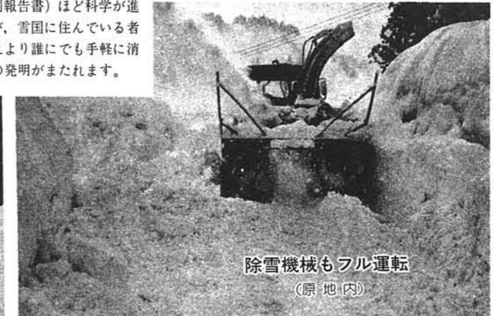
除雪機械もフル運転 (原地内)

完成後初の冬を迎えた克雪広場は、無雪駐車場として当初の目的どおり威力を発揮し、使用料がタダということもあって利用者から大変喜ばれています。(原 克雪広場)