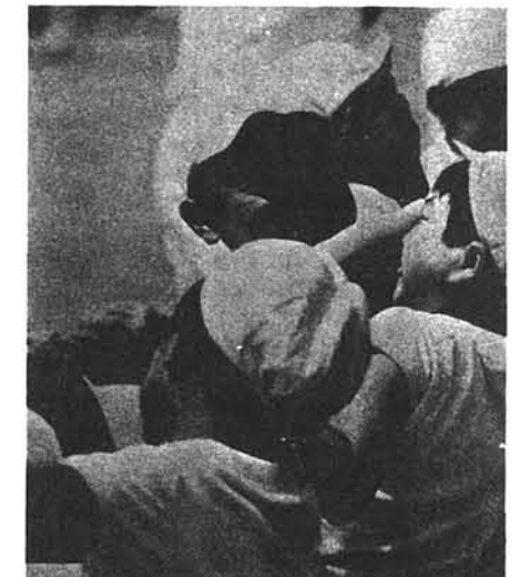
▼ワッショイ ワッショイ 綱引き(上)