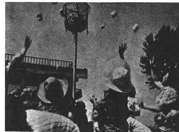
◀なかなか思うように入らないナ(下)

小国町体育協会では本年度より、体育功労者及び優秀競技者に対し栄章を贈り、その名誉を表彰することになりました。