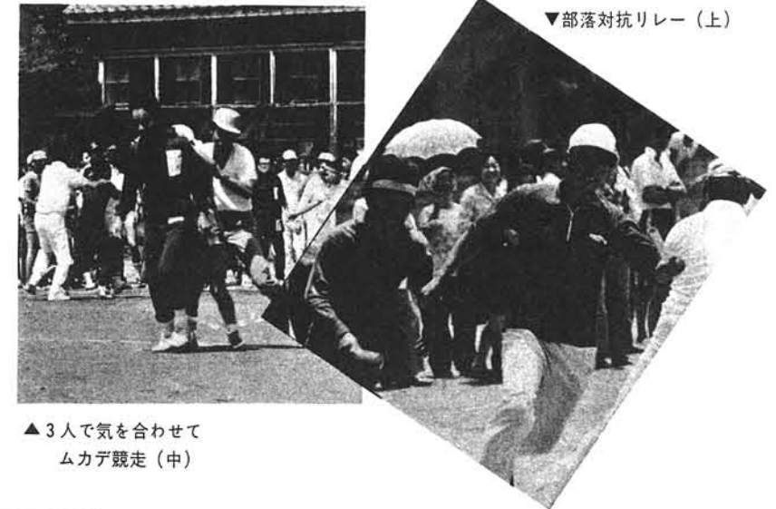
▼部落対抗リレー(上)