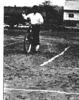
左に曲ります。(中里小)

横断歩道は、信号機があるところは、青になったら左右の安全を確かめて、信号機のないところは左右をよく確かめて、手を上げて渡りましょう。(中里小)