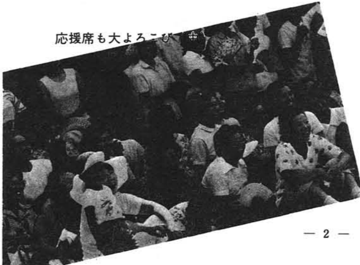
応援席も大よろこび