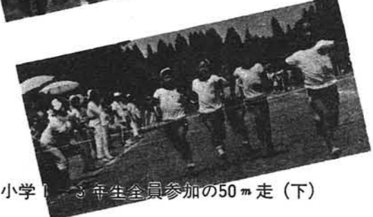
小学3年生全員参加の50m走(下)

町の人口 7月31日現在 ( )前月比 男 4,896人(-5) 女 5,102人(-3) 計 9,998人(-8) 世帯数 2,335(-4)