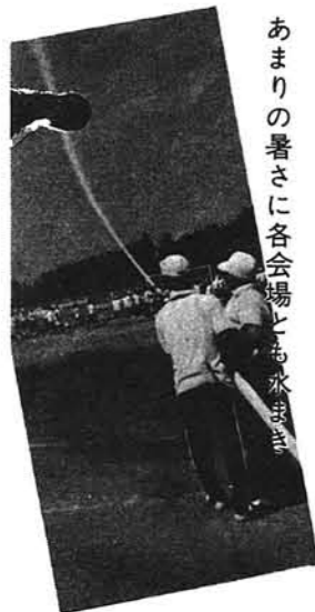
あまりの暑さに各会場とも水まき