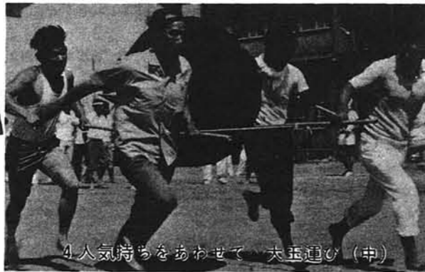
4人気持ちをあわせて、大玉運び(中)