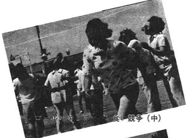
ゴールめきして「食い競争」(中)