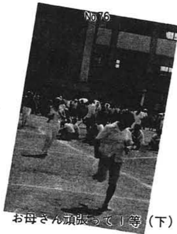
お母さん頑張ってる(下)