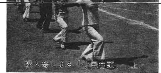
婦人会による「小国管舞」(上)