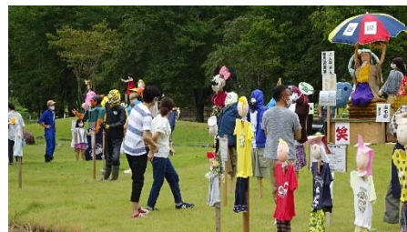
第11回 「おぐにかかしまつり」の様子