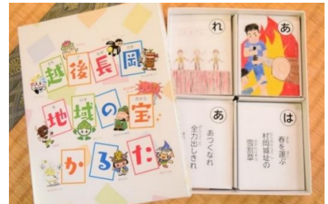
65ミリ×84ミリ（小）のかるた