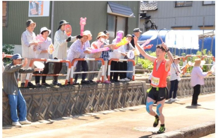
沿道での熱烈な声援が、ランナーの折れそうな心を支え、完走への後押しをしました。