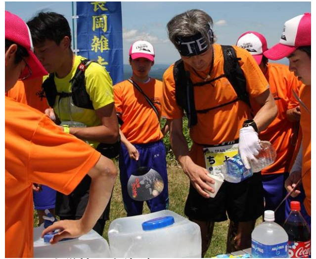
小国中学校の生徒が、八石山の頂上のシークレットエイドへ飲み物を担ぎあげました。