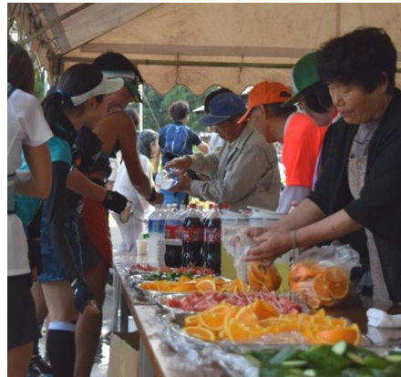
各エイドでは、地域のみなさんがおもてなし。ランナーは、笑顔とスタミナを補給して走り続けました。