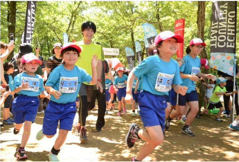
小国小学校の児童も元気いっぱいスタート！