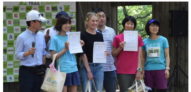
やりきった表情の入賞者の皆さん。おめでとうございます。関係者のみなさん、お疲れ様でした！