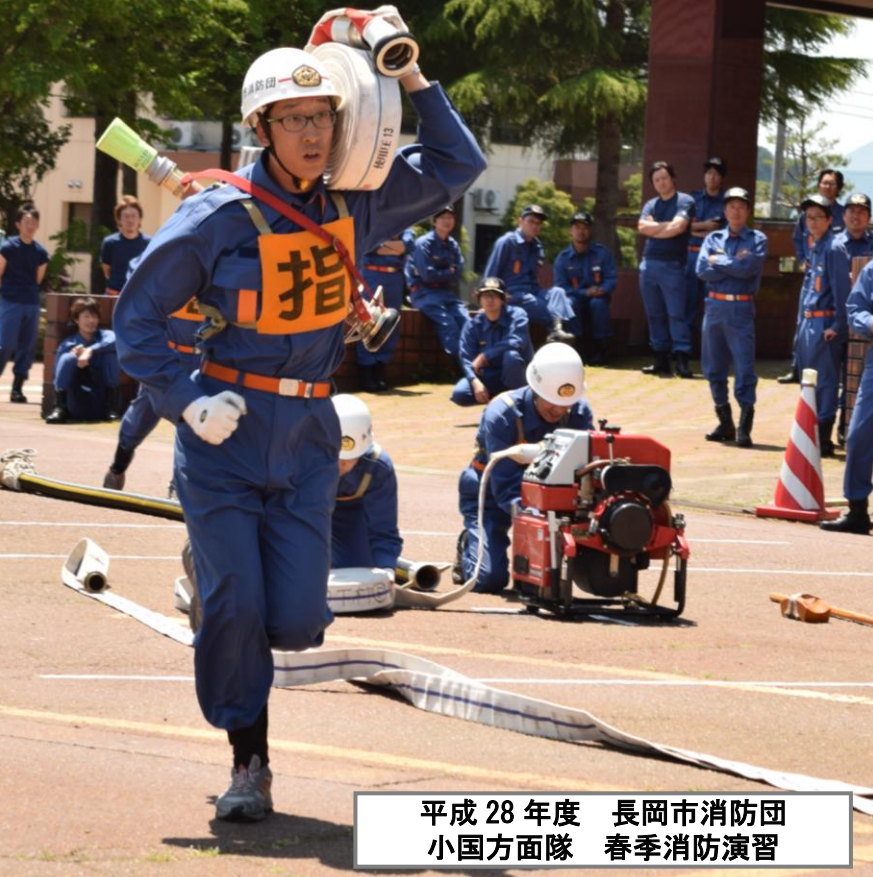
平成 28 年度 長岡市消防団 小国方面隊 春季消防演習