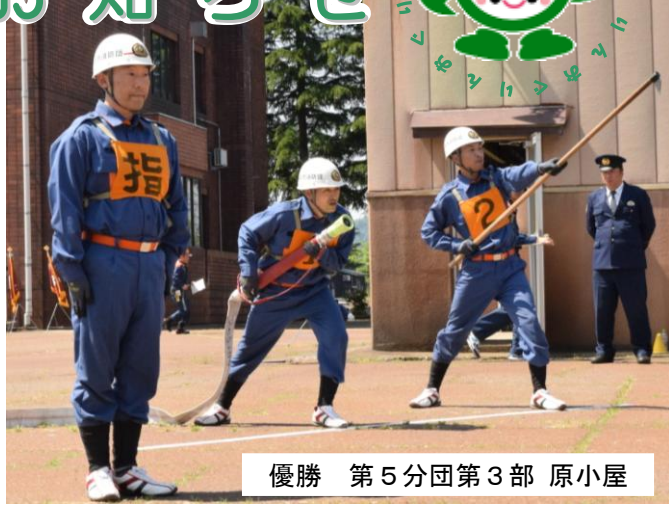
優勝 第 5 分団 第 3 部 原小屋