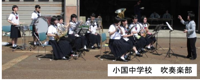
小国中学校 吹奏楽部