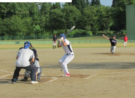
優勝した高校生チーム