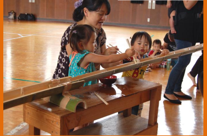
おぐにママさんの会

7月7日(火)、さくらの会が行われました。参加者は33名。脳トレをした後、七夕の俳句を短冊にしたため、午後は体操と内容は盛り沢山。元気の秘訣は、みんなでワイワイ言いながら楽しい時間を過ごすことなんですね♪。