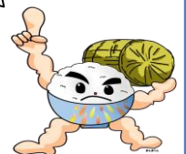
長岡うまい米キャラクター「まんまくん」