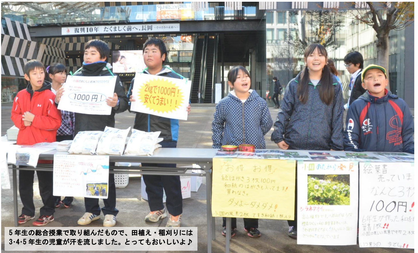
5年生の総合授業で取り組んだもので、田植え・稲刈りには3・4・5年生の児童が汗を流しました。とってもおいしいよ♪