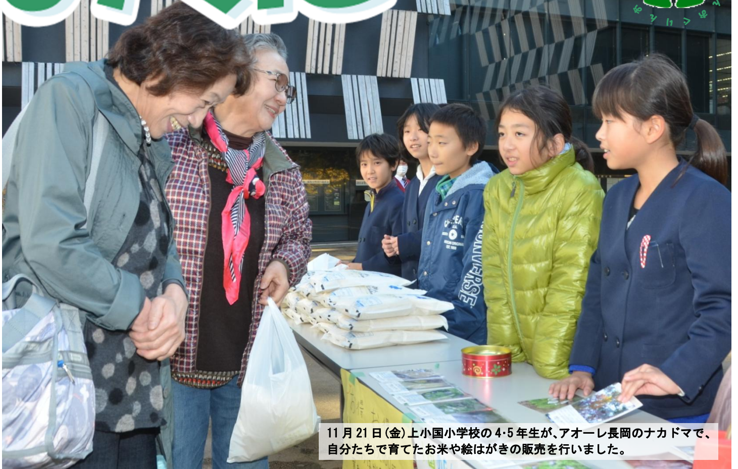
11月21日(金)上小国小学校の4・5年生が、アオーレ長岡のナカドマで、自分たちが育てたお米や絵はがきの販売を行いました。