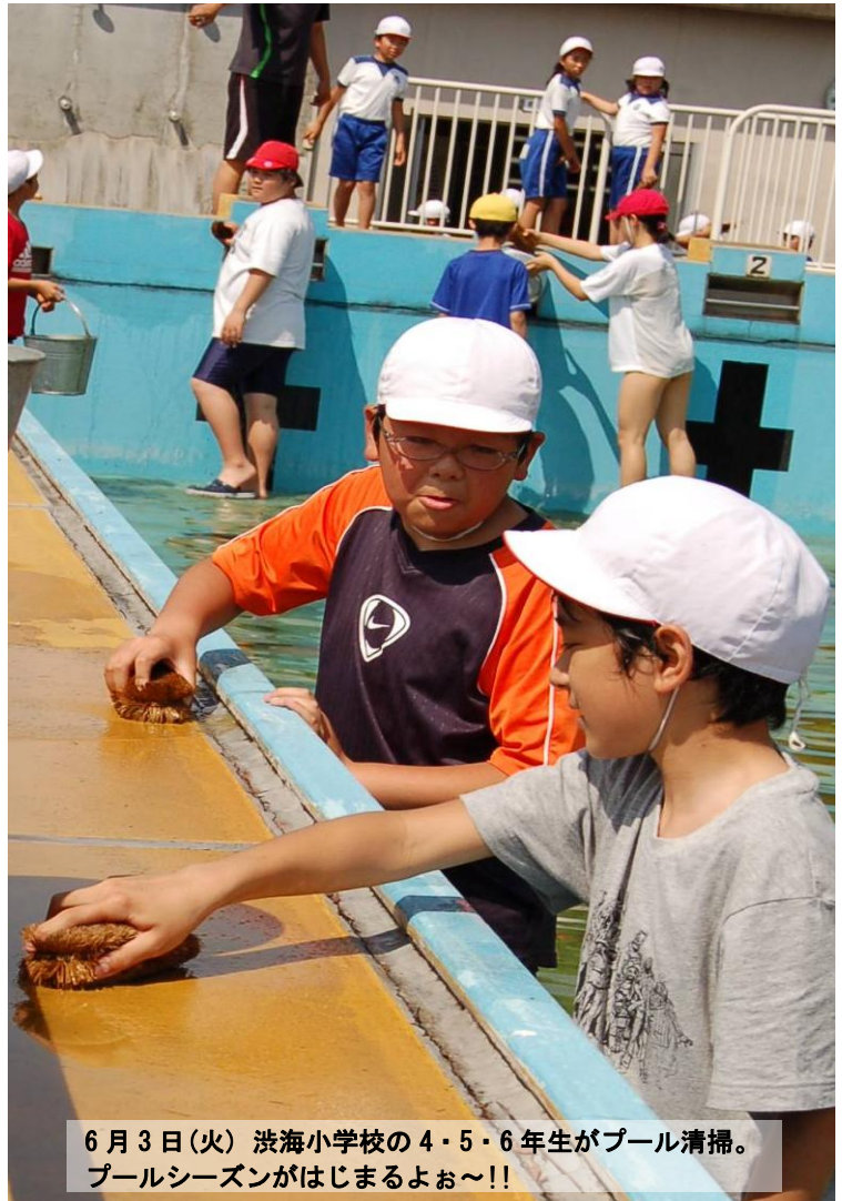
6月3日(火) 洗海小学校の4・5・6年生がプール清掃。 プールシーズンがはじまるよお~!!