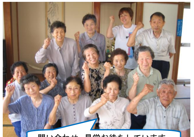
問い合わせ・見学お待ちしております。

小国で一番最初に始まったけんこつ体操教室です。 「効果がある」と、1km歩いて参加する人もいます。 インストラクターの話の聞いたり、参加者と交流する 楽しみがあり、意義を感じています。 けんこつ体操を行っていない人より、姿勢が良いのが 自慢です。