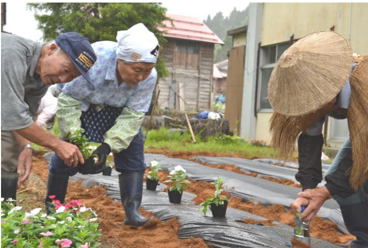
6月12日(木) 雨にも負けず!花植作業 八王子老人クラブ