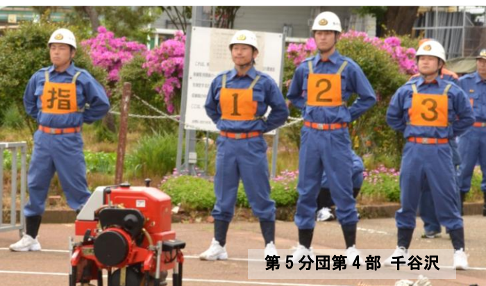
第5分団第4部 千谷沢