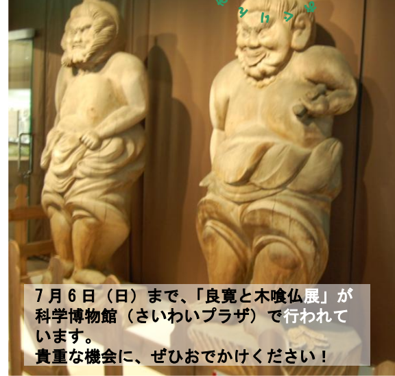
7月6日(日)まで、「良寛と木喰展」が 科学博物館(さいわいプラザ)で行われて います。 貴重な機会に、ぜひおでかけください!