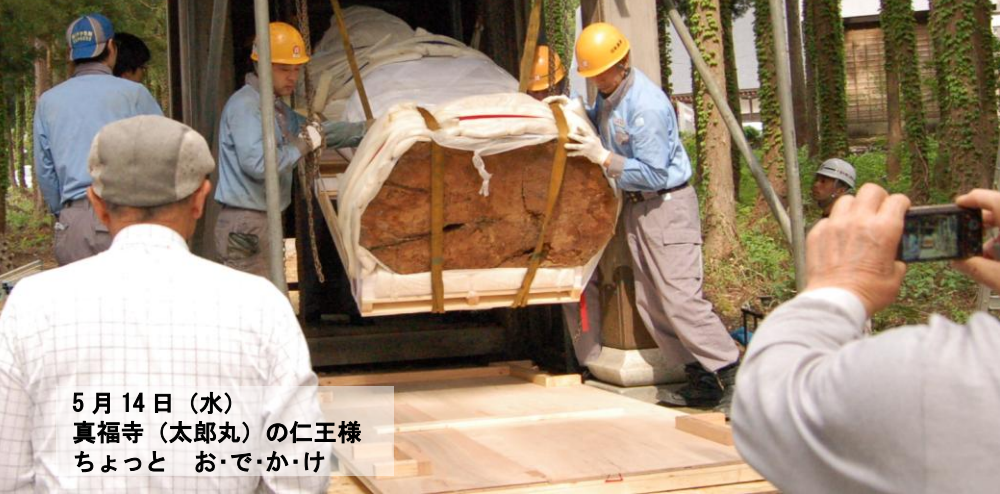
5月14日(水) 真福寺(太郎丸)の仁王様 ちょっとおでかけ