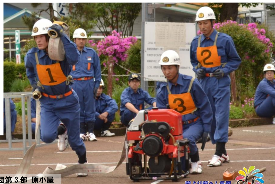
第5分団第3部 原小屋