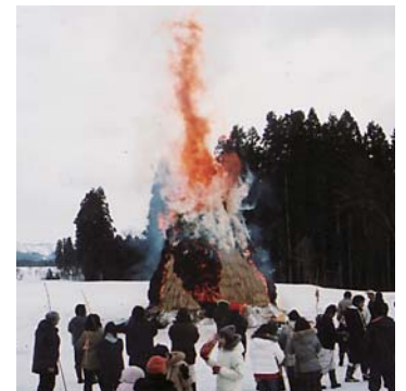
▲東が丘地区 さいの神