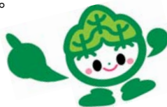
小国地域の人口(平成23年6月1日現在)