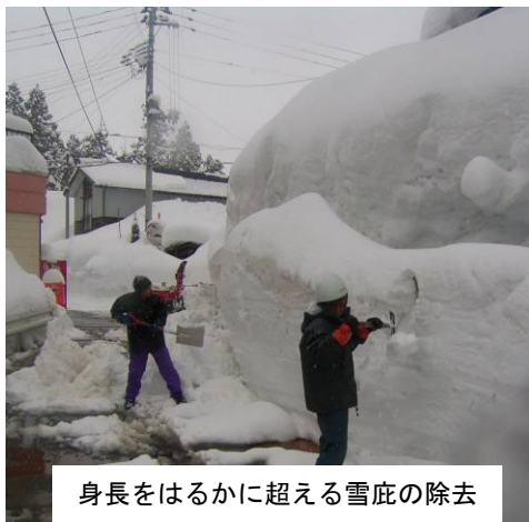
身長をはるかに超える雪庇の除去

小国地域の積雪は1月31日に255cm（観測地点：小国支所）を記録し、345cmを記録した昭和60年度以来の豪雪となりました。（※近年の豪雪記録 平成21年度：最大210cm 平成16年度：最大240cm）