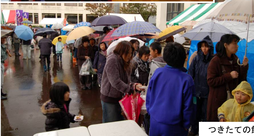
つきたての餅に長蛇の列