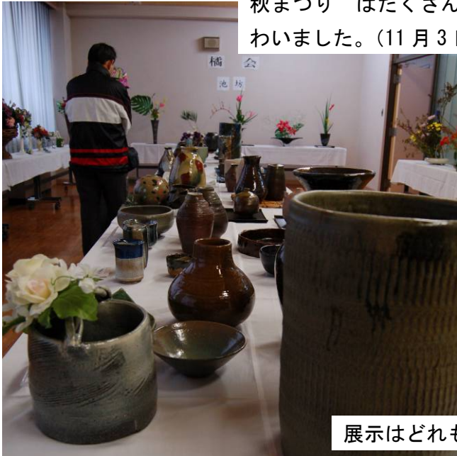
展示はどれも力作ぞろい!