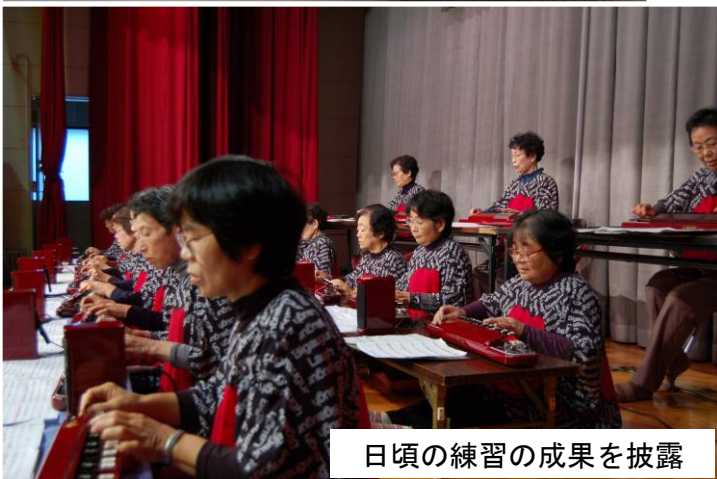
日頃の練習の成果を披露