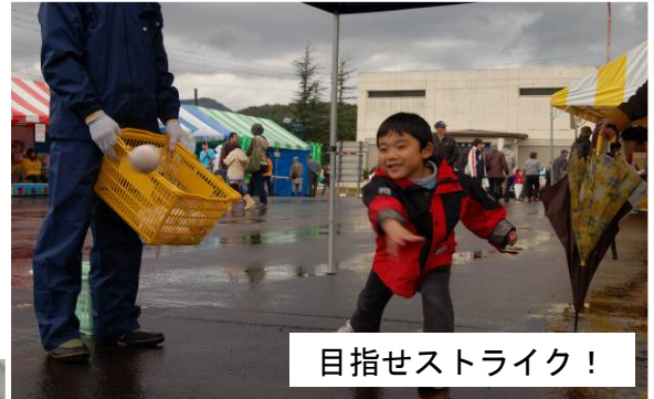
目指せストライク!