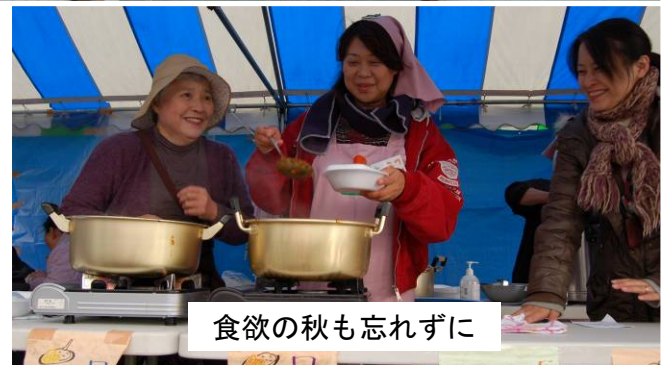
食欲の秋も忘れずに