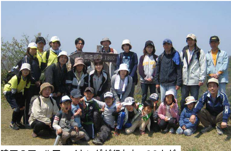
晴天の下、八石ハイキングが行われ、26人が 無事登頂を果たしました。(4月29日)