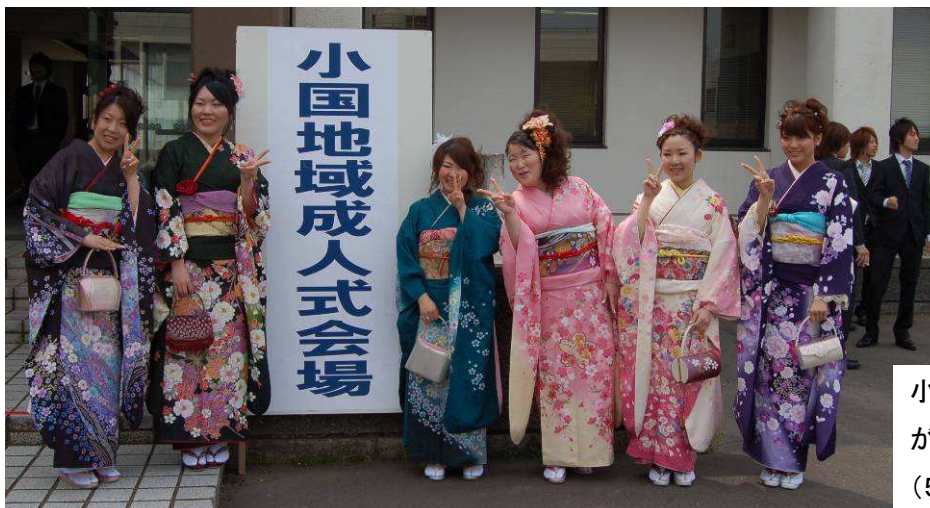
小国会館で成人式が行われ、57人 が成人の仲間入りをしました。 (5月3日)