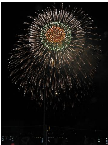
ベスト7ス超大型スターマイン