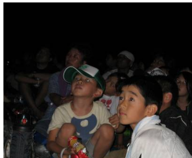
花火にくぎ付けの児童たち

新潟県中越沖地震で校舎が被災した下小国小の児童を励まそうと、まつり協議会と復興を支援するNPO法人が児童と保護者92名を大花火大会に招待しました。長岡まつりの花火を初めて間近で見た人が多く、夜空いっぱいに広がる大輪に大きな歓声を上げていました。(8月3日)