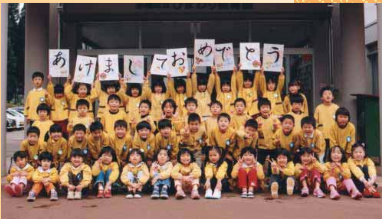
(ひまわり保育園 年長児のみなさん)