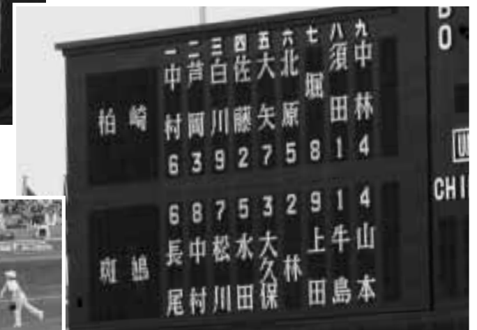
▲両校のスターティングメンバー