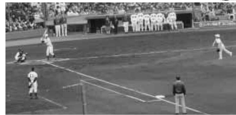
▲文部科学大臣による始球式