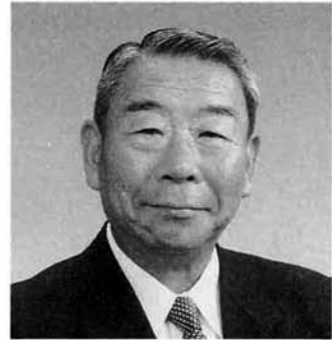
町長 大橋 義治

あけましておめでとう ございます。 町民の皆様には、お健 やかで新春をお迎えのこ とと存じ謹んでお慶びを 申し上げます。