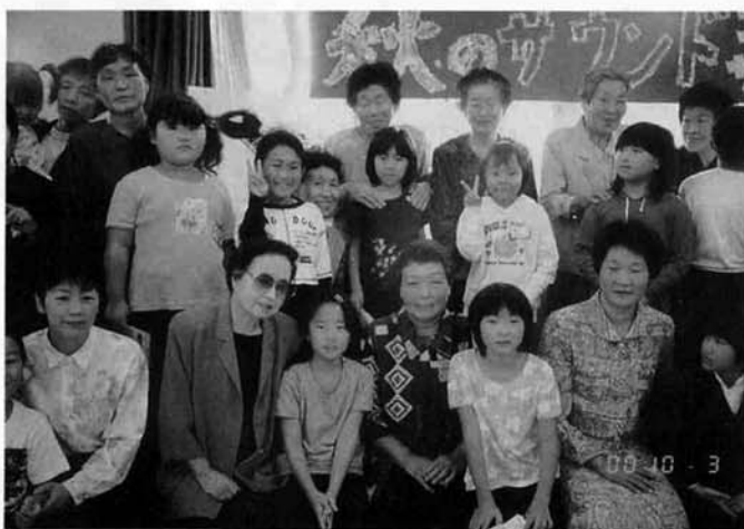
フィナーレの後、家の方々と一緒に…

「風にのせて 秋のサウンドコンサート」 ♪楽しい笑顔 あふれるサウンド 光りだす♪ を行いました。たくさん家の方から来てい