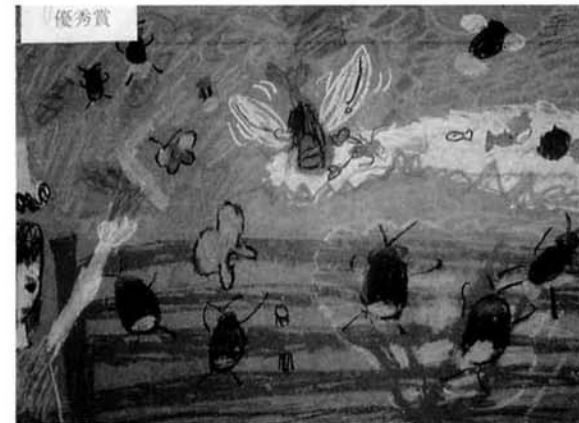
中島美咲さんの作品