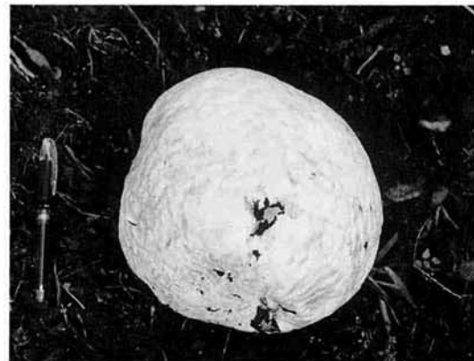
写真左のボールペンはミニチュアではありません

成熟する前で、中が白いうちは食べることができるそうです。発見されたキノコは既に成熟したもので食用にすることはできませんでした。