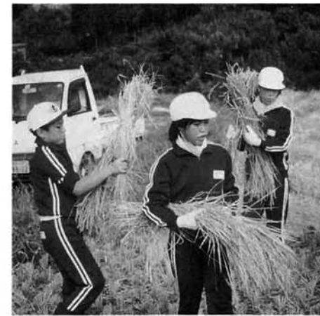
稲刈りを体験する児童

春から地域の方々にお世話になりながら米作りに取り組んできました。初体験の子どもも多く、驚きと感動の連続でした。稲刈りでは、鎌の使い方、稲の縛り方、はさのかけ方どれもこれも根気と技術がいる大変な仕事だということを実感しました。また、祖父母参観には、お年寄りに縄ないを教えてもらいました。うまくいかず四苦八苦した体験でした。その後、5年生繩なない教室を開催し、他学年との交流も深めました。教室では、これらの体験学習の過程で浮かんでくる疑問を調べ、学習により明らかにしていきます。小国米についての新たな発見に子どもたちの顔もほころびます。「育てる」「つくる」「調べる」「食べる」という一連の学習は、子どもたちにとって魅力ある活動になりそうです。