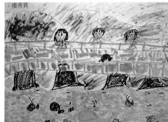
渡辺彩菜さんの作品