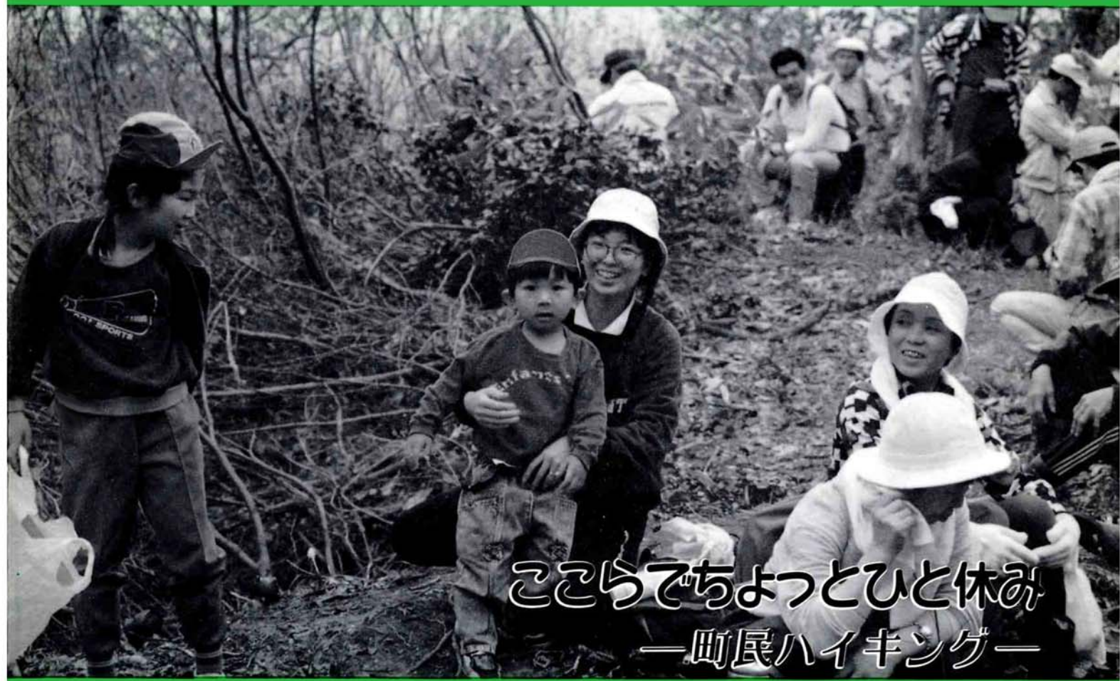
こころでちよつとひと休み —町民ハイキング—