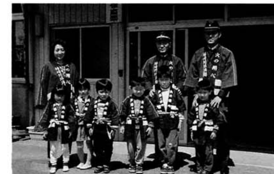
そろいのパピで呼びかけ火の用心

マイクから流れるかわいい声での呼びかけにおもわず車が過ぎても見ている人もいました。