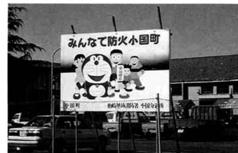
ドラエもんも呼びかけ火の用心

これは分遣所の所員が1ヵ月の期間をかけて作成したもので、縦185cm、横275cmの大きさです。