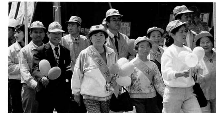
5月11日 柏崎市で行われた交通安全パレード

通勤・通学・レジャーと車は我々の生活になくてはならないものですが、自分の腕を過信しないで、安全意識を自覚して運転をするようつとめて下さい。