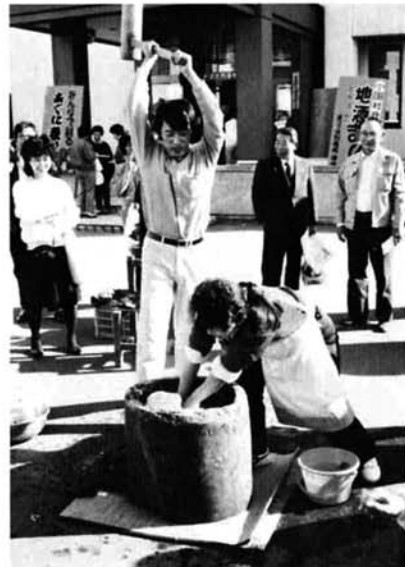
力自慢のもちつき大会(食べもの広場)