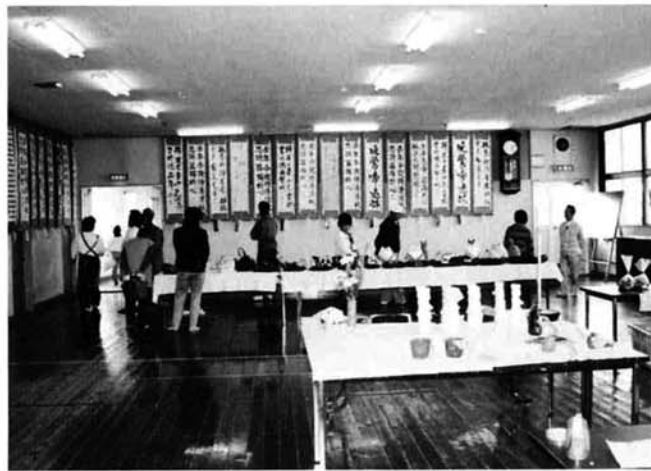
老人クラブやおぐに荘の人たちの力作を展示(中央公民館)