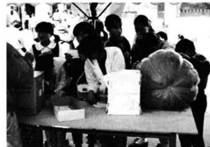
大カボチャの重さ当てクイズ。正解は45kgでした。ピタリ正解者は0名。45.3kgと答えた人2名に豪華な商品が送られた(森林組合展示コーナーで)