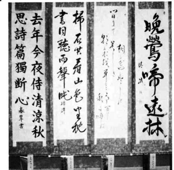
(おぐに秋まつり出展)