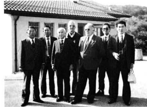
ロマンモティエ町庁舎前で記念撮影。スイスでは自治体の長は非常勤で、アムスティン町長は郵便局長です。

昨年の民間友好訪問団に続き、今回、小国町の公式訪問団が訪れ、友好親善を深めてきました。今月号から、シリーズでこの訪問の記録を紹介いたします。