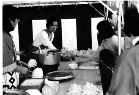
(上) 秋晴れのもと、食べもの広場は大勢の人たちで賑わった (下) 山野田振興組合自慢の地鶏汁。大好評でした(食べもの広場)