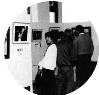
プロも顔負け傑作揃いの写真展(就改センター)