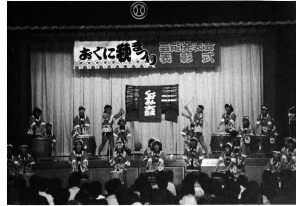
10月の発表会(初演奏)に引き続き、秋まつり芸能発表会で鮮やかな袴姿を披露。万雷の拍手をうけ、アンコール演奏にも応えたしづみ太鼓