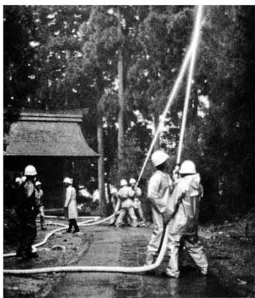
真福寺境内での放水訓練 ▲