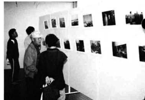
ロマンモティエ公式訪問団のパネルを展示(就改センター)