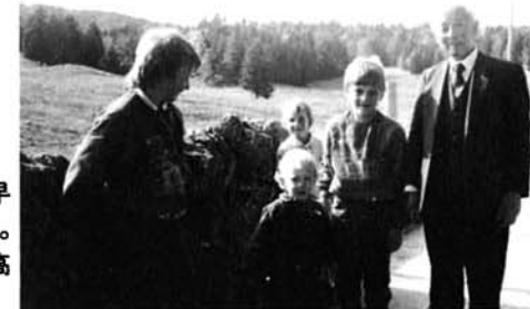
地元の子ともたちと早速小さなふれあい交流。(ロマンモティエの高原牧場で)