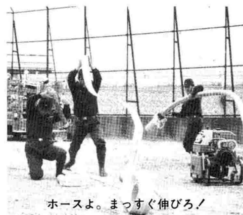
ホースよ。まっすぐ伸びろ！

消防団規則操法訓練 六月十九日、中之島北中学校グラウンドで、町の消防団員の半数が出動し、消防団規則操法訓練が行なわれました。なお、八月七日に十日町市で行なわれる第三十九回新潟県消防大会に、中之島町自動車隊が出場します。日頃の成果が十分に発揮できるよう、おおいに頑張ってもらいたいです。