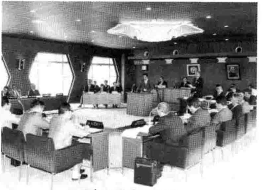
6月定例議会の様子