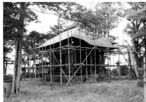
▲鞍掛神社修復工事

町の文化財に指定されている宮内の鞍掛神社ですが、傷みがひどく、このままの状態では倒壊の恐れがあるというので解体復元することになりました。春には工事も終わり、また皆さんとお目にかかれる予定です。