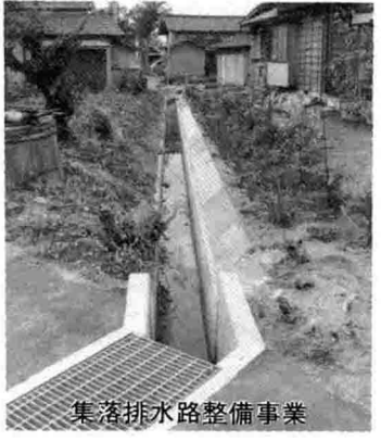
集落排水路整備事業