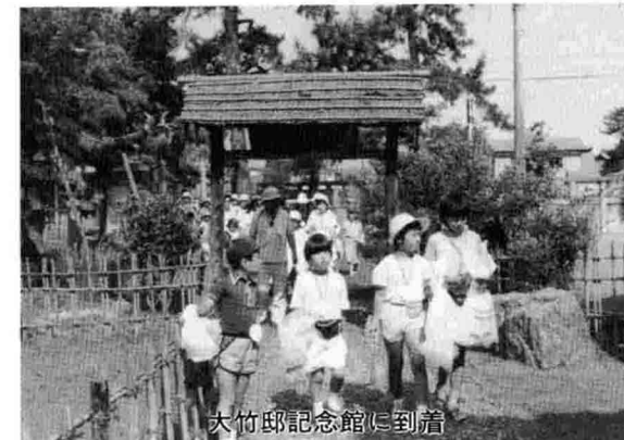
大竹邸記念館に到着