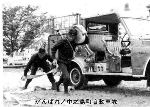
がんばれ！中之島町自動車隊

町の文化財に指定されている宮内の鞍掛神社ですが、傷みがひどく、このままの状態では倒壊の恐れがあるというので解体復元することになりました。春には工事も終わり、また皆さんとお目にかかれる予定です。