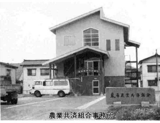
農業共済組合事務所

昭和六十三年中之島町老人保健特別会計補正予算について——補正額は七百八十六万九千円を追加し、総額を五億四十九万八千円としました。