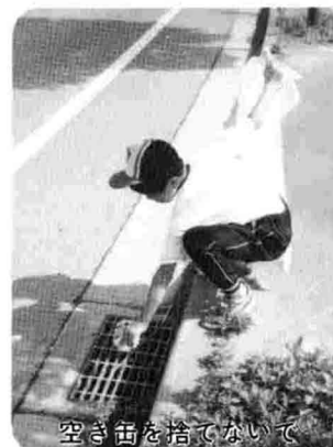
空き缶を捨てないで

六月二六日、梅雨晴れの中、町商工会青年部主催による第七回「ふるさとを歩こう」が行なわれ、親子づれなど一三名が参加しました。今回は、町の史跡などをめぐらただけでなく、同時に空き缶拾いも行なうなど町の環境美化にも一役買っていただきました。