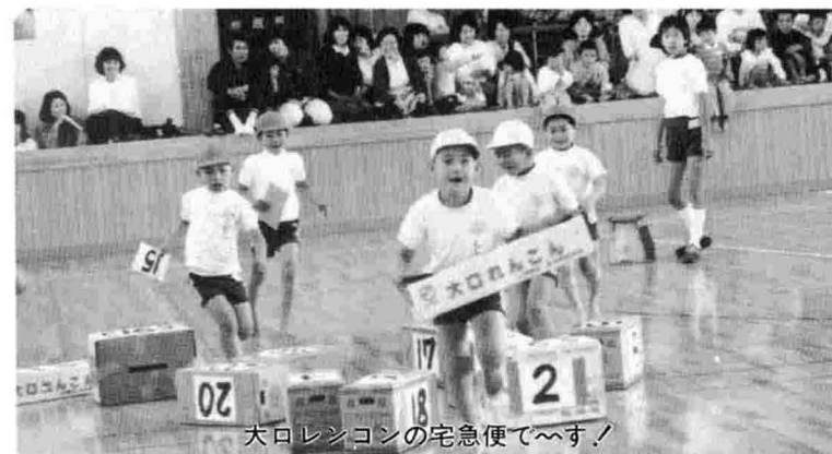
大通レンコンの宅急便で〜す！

消防団規則操法訓練 六月十九日、中之島北中学校グラウンドで、町の消防団員の半数が出動し、消防団規則操法訓練が行なわれました。なお、八月七日に十日町市で行なわれる第三十九回新潟県消防大会に、中之島町自動車隊が出場します。日頃の成果が十分に発揮できるよう、おおいに頑張ってもらいたいです。