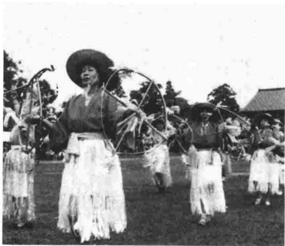
▲雨に咲いた島田音頭…衣裳もいいですが踊りもけっこういいんですよ。でも雨じゃねえ。