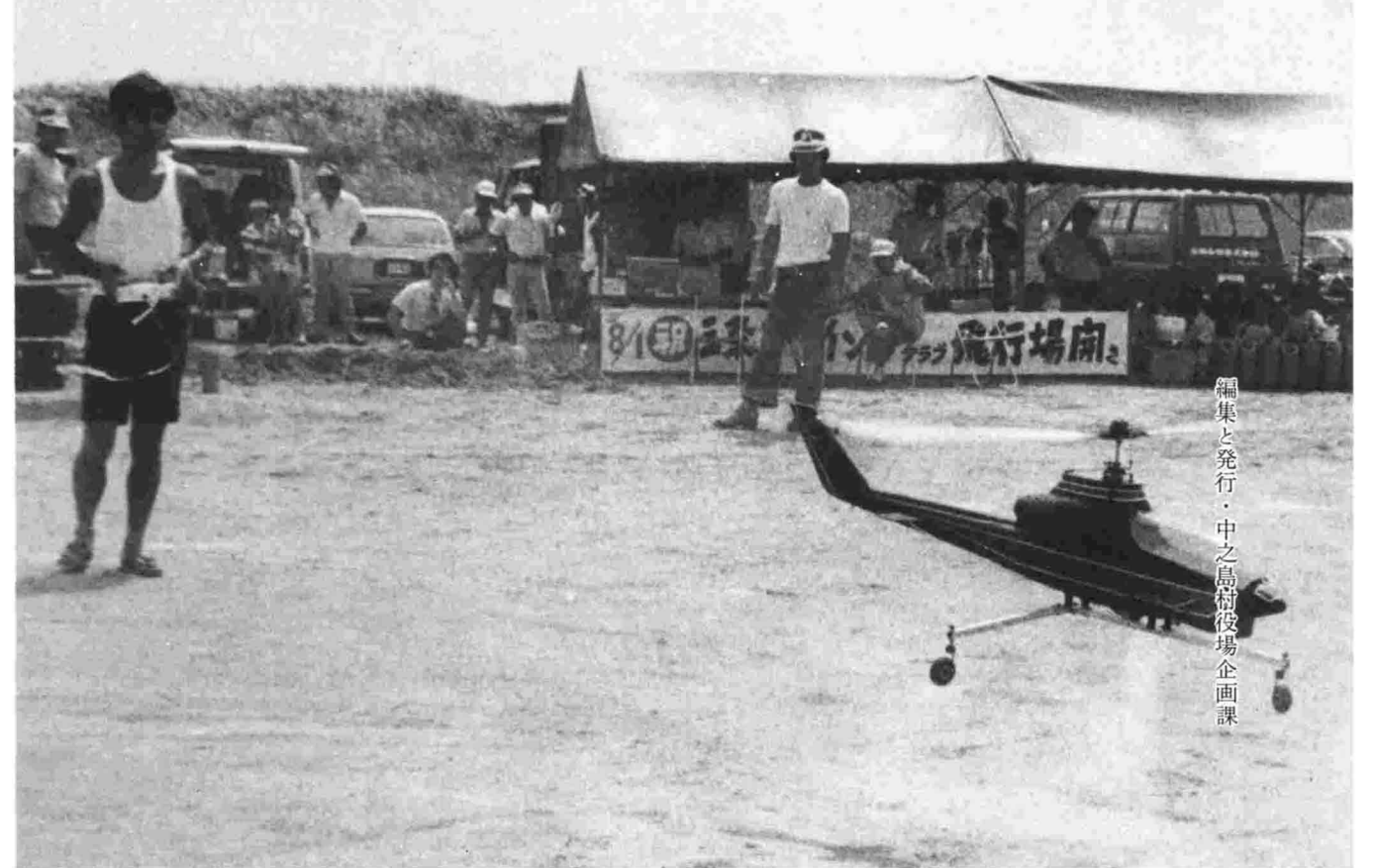
編集と発行・中之島村役場企画課