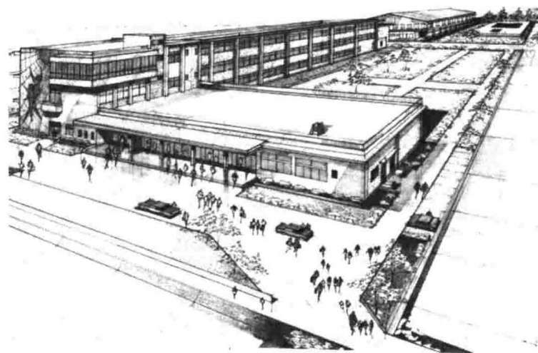
▲中央小学校完成予想図