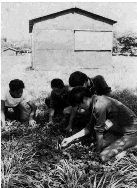
クラブ練習の合い間をぬって薬草採取に励む水泳部員たち。