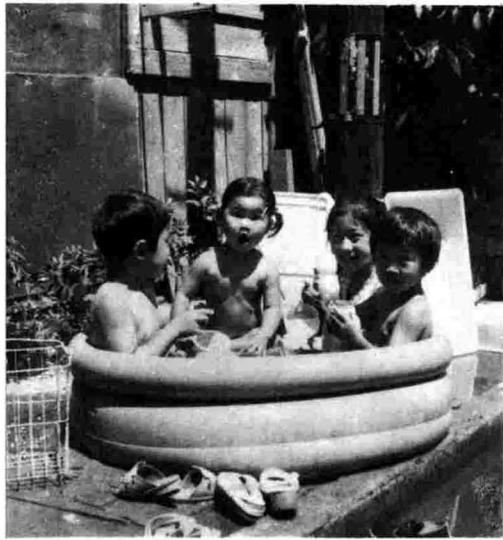
まだ酷暑 ところどころにこういつたチビちゃんの 可愛いらしい光景が目につきます