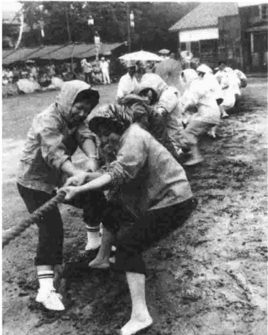
この日のために力をためておいた▲のに、下は泥んこ、まるで力が出やしない。おまけにびっくり返って引っ張らばだいなしさ