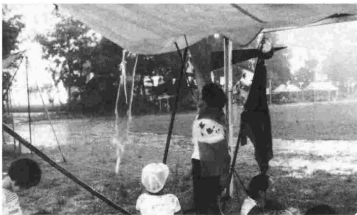
▲見てください。この雨の中、やったんですから