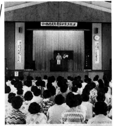
考え、行動 する消費者に 中之島村消費 者協会が誕生