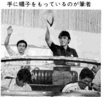
手に帽子をもっているのが筆者

他のたとえば肺の手術などでは、食事さえ取りながら手術が続けられるという。 中国ではほとんどの手術がこのハリ麻酔で行われる。身体の一部にハリを刺したただ身に麻酔がかかり、それでいて意識にはなんら影響がないのである。西洋外科医学の麻酔薬に對するこの利点は、出血が少なく回復が早いということ、これらすべて中国古来の医法に基くものだということがあった。また、それと同時に漢方薬の研究も盛んで、現在では注射液などにも広く使用されているとのことで、病院で薬草を積極的に栽培しているあたり、さすが中国らしい感じがした。