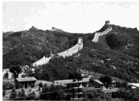
長さ2,400kmにもおよぶという万里の長城

私達は、上海の病院でハリ麻酔の実際を見てもらう事になった。白衣に帽子といういでたちで手術室に入ると、中は胃潰瘍の手術の最中で、既に胃はとり出され、切開を終えてぬわれているところであった。 ところが手術台上の患者は、入ってきた我々に笑顔で会釈をしてくるのである。話しには聞いていたものの、その実際を目のあたりにして我々はただ驚くばかりであった。 手術中に缶詰やお茶を……消化器系の手術はともかく、