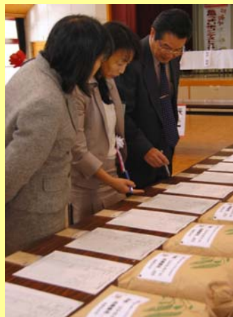
▲会場では、上位 100 点のお米の履歴を公開。

長岡市の米生産農家が追求する「安全・安心・美味しい」をPRするため初開催となった、「長岡うまい米コンテスト 2009」。最終審査会場となった中之島公民館では、上位 100 点のお米が揃い生産者や消費者の交流も図られました。