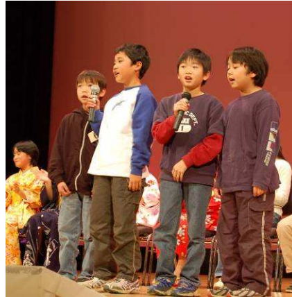
大きな歌声で会場を元気にしてくれました「中之島音頭大スキーズ」 (中之島中央小学校)