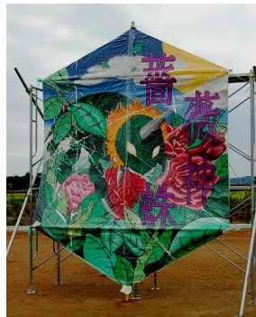
大風をモチーフに作成した応援マスコット▲