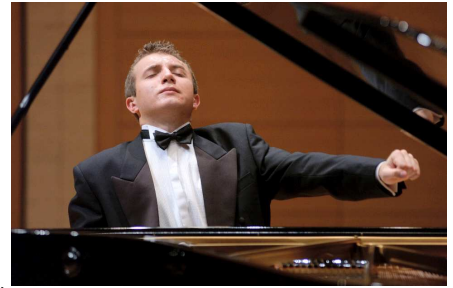
世界的ピアニストの演奏をぜひこの機会に