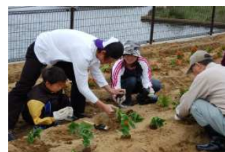
花と緑のふれあい通り

信条小で県警察「ゆきつばき号」の楽しい交通安全教室を開催。上手に横断歩道が渡れました。(4月26日)