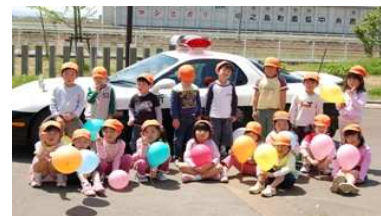
パトカーの前で記念撮影

交通安全保育園訪問 春の交通安全運動期間中 に見附警察署がみずほ保 育園を訪問。(5月14日)