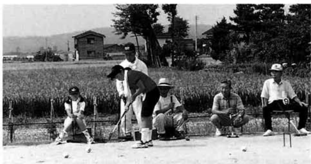
いいフォームで打っています

また、八月十一日(月)には、上通小学校と中之島中学校の児童生徒によって配食サービスが行われました。 自分たちで作ったおべんとうを町内に住むお年寄りのみなさんに届け、食べてもらう。この配食サービスボランティアに参加した約三十人の児童生徒は、「お年寄りが笑顔で言ってくれよう、ありがたう」の言葉がとてもうれしかった。今年度、また是非参加したいなどと、感想をもらっていました。