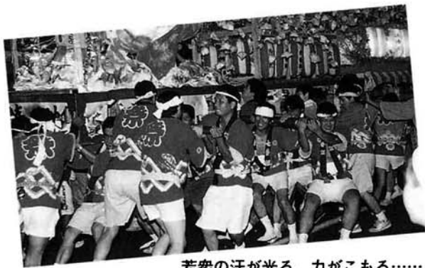
若衆の汗が光る、力がこもる……

今年も勇壮な押し合いが 毎年、八月二十五日、二十日は中之島諏訪神社の秋の大祭。二十五日の宵宮には、今年も勇壮な灯籠押し合いが繰り広げられました。 大字中之島の七つの町内の大燈籠を連結し、若衆がこれを激しく押し合う姿は勇壮そのもの。沿道を埋めた多くの観客と一体となって盛り上がる、暑い夏の一大イベントです。