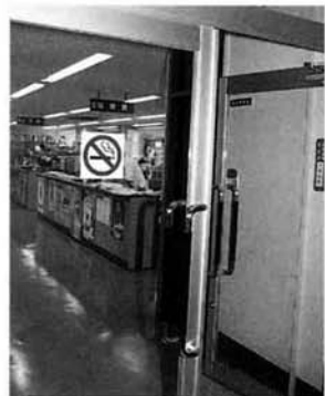
▲役場庁舎内の各会議室や事務室は禁煙に