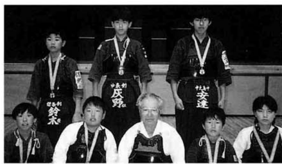
特別賞を受賞した中之島剣道会のみなさん

中之島剣道会が特別賞を 七月二十六日(土)に新潟市・鳥屋野総合体育館で開催された「第十回新潟県警察少年柔道剣道大会」で、剣道の部に出場した中之島剣道会のみなさんが特別賞を受けました。 この特別賞は、礼儀作法や試合態度が立派であったチームに贈られる、県警本部長及び県防犯協会長表彰です。 このたびの受賞を励みとし、中之島剣道会のみなさん、さらにながばってください。