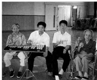
お年寄りと貴重なふれあい体験

昨年整備された「真野代ふれあいゲートボール場」で、お年寄りや子供たちが一緒にゲートボールの練習に励みました。 これは、町社会福祉協議会主催の「ふれあいゲートボール大会」に出場に向け、事前に合同練習を重ねているお年寄りのみならず、「子供は上達が著しい」と、驚いていました。