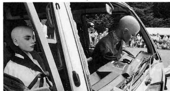
時速40kmでの衝突実験でシートベルト非着用のダミー人形はフロントガラスを突き破りました