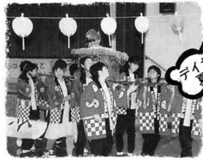
デイサービス夏まつり