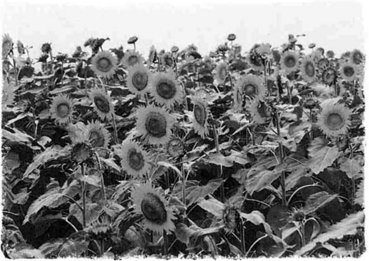
ところ狭しと咲き乱れたひまわりの大輪

六月二日に種まき、七月七日に土寄せをし、現在は約二十アールの畑いっぱいに見事な花が咲き乱れています。