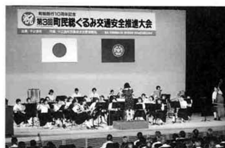
アトラクションでの中之島中学校吹奏楽部の演奏

町民の交通安全意識の高揚を図り、悲惨な交通事故を根絶することを願い、七月二十五日（木）に「第三回町民総ぐるみ交通安全推進大会」を開催しました。 町制施行十周年の記念大会となった今回は、華やかな交通安全パレードで幕開け。中之島諏訪神社前から町民文化センターまでの約八百メートルを、県警の白バイ二台が先導する中、総勢百二十人を超えるパレード隊がさっそうと行進しました。 町民文化センターに到着後、駐車場にて県警音楽隊・カラーガードが華麗なドリル演奏を披露。その洗練された見事な踊りと演奏に、大きな拍手が沸き起こりました。 文化ホールに会場を移した後、優秀運転者表彰、小・中学生の代表による作文発表や誓いの言葉、中之島中学校吹奏楽部と県警音楽隊によるアトラクション、大会宣言などを行い、参加者のみなさんとともに「交通安全の大きな輪」を広げることができました。