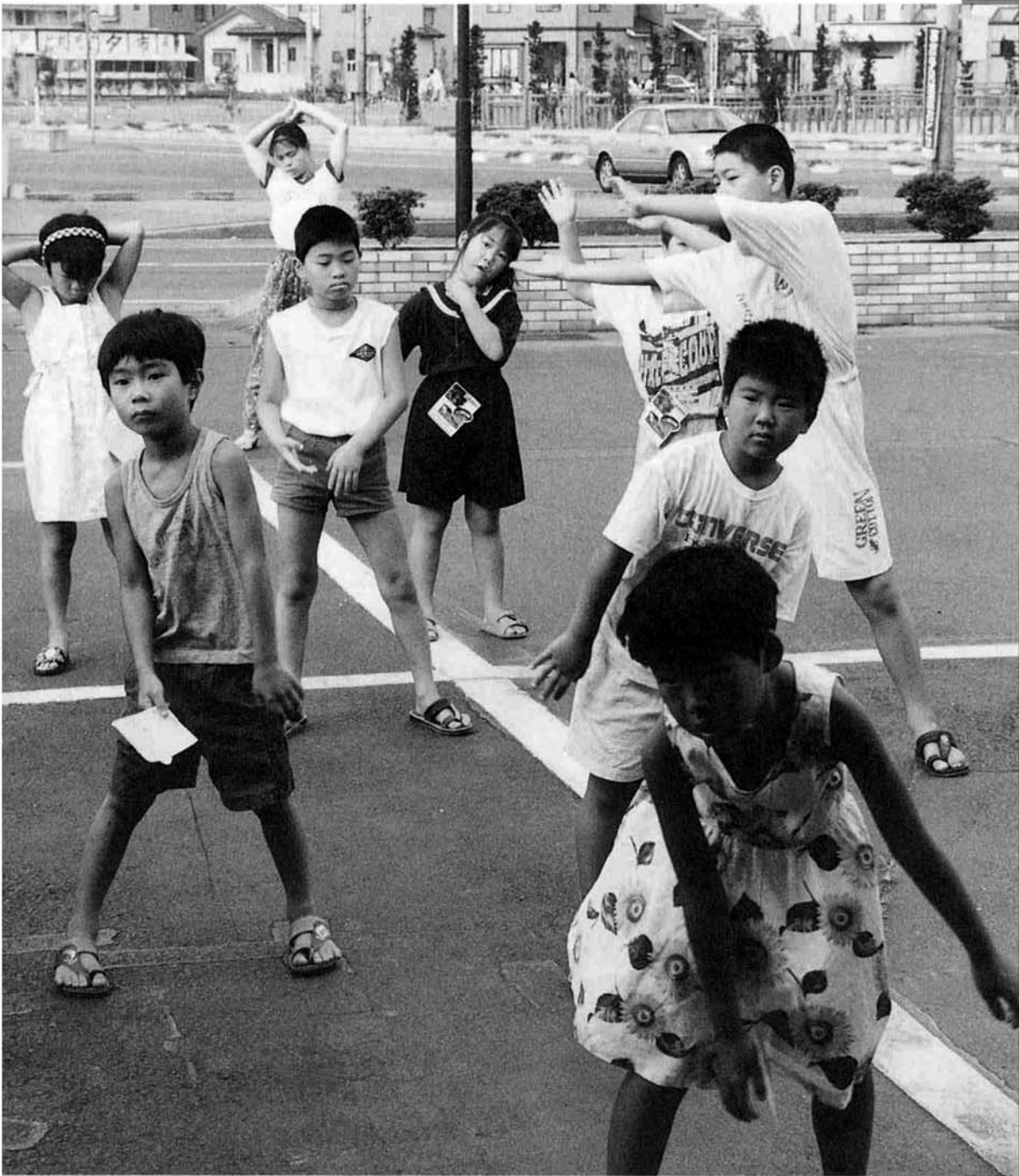
8月1日(木) 役場前にて撮影