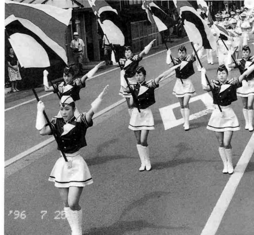
約800mを行進した交通安全パレード隊