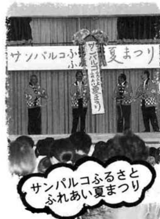
サンバルコふるさとふれあい夏まつり

※サンバルコなかのしまでは、使い古しのシーツやタオルを集めています。ご家庭で不要なものがありましたら、提供してくださいようお願いいたします。