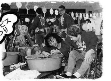
与板町「志保の里荘」利用者も参加して