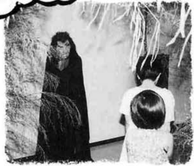
おばけやしきコーナーも登場