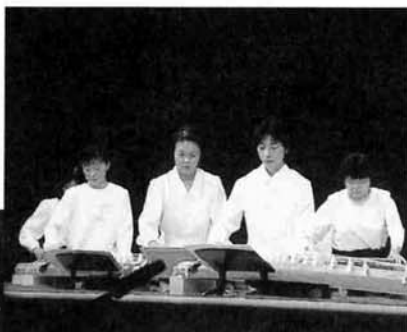
第2回マナビプラザなかのしまフェスティバルから

中野東村神楽伶人会のみなさんによる神楽舞を皮切りに、民謡や和琴演奏、寸劇などが次々に披露され、会場は盛んな拍手に包まれました。