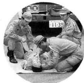
見附市消防本部レスキュー隊による救助法実演も