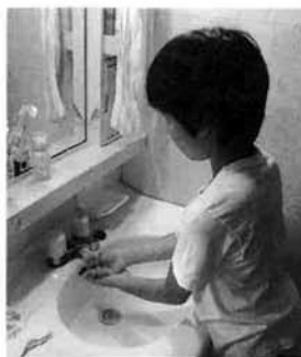
こまめに手を洗いましょう