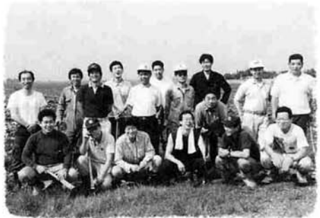
中野東「月曜会のみなさん」