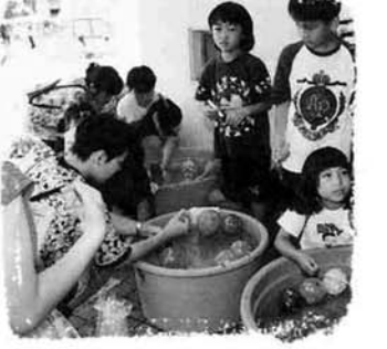
中条保育所・児童館