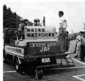
「シートベルトコンピンサー」を使った時速5kmの衝撃体験