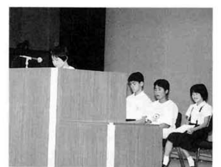
代表児童・生徒による作文発表