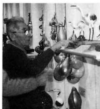
昨年の「工芸作品展」