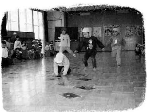
上通保育所のゲーム大会

冬期間は暖房器具を使うため、火災が起こりやすい時期です。火の元には十分注意して、火災の予防に努めましょう。