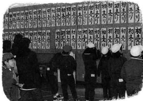
中之島中央小の書き初め展