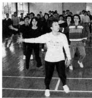
昨年のレクダンスinなかのしま