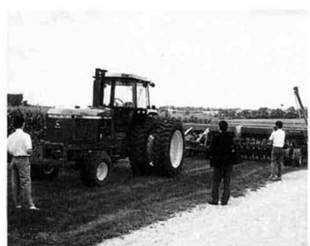
アメリカ農家の大型トラクター

ロサンゼルスに着き、初めてアメリカに立った感想は「あれ？暑くない」でした。日差しが強かったのでかなり暑そうでしたが、実際は湿度が低いため、温度のわりに涼しく感じるそうです。このため稲は、病害虫の被害が少ないそうです。その点は稲にとっても、人間にとってもうらやましく思いました。