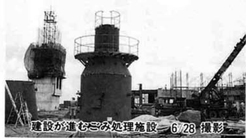
建設が進むごみ処理施設 6/28 撮影