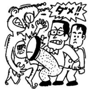
青少年を非行から守る 全国強調月間

法務省主唱の「社会を明るくする運動」は、国民一人一人が犯罪の防止と罪を犯した人たちの更生について理解を深め、それぞれの立場において力を合わせて、犯罪や非行のない明るいまちづくりを目指すことを目的に、全国的な運動として、毎年七月に展開されています。 総務庁主唱の「青少年を非行から守る運動」は、同時期に実施されますが、その行事と相互に連携をとりながら運動が展開されています。 私達のまわりから、非行を犯す少年を出さないよう一人一人が力を合わせましょう。 また、不幸にして非行に陥った少年の更生を援助しましょう。