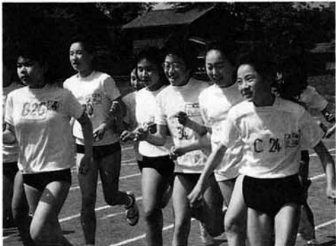
健やかに育ってほしい子供達