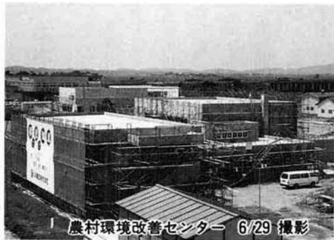
農村環境改善センター 6/29 撮影

ちなみに藤山工業団地、中之島工業団地での全体雇用計画では新規雇用約五十名、全体生産額は(昭和六十三年は七十六億円)全社が操業した場合、百三十億円程度になるものと見込んでいます。