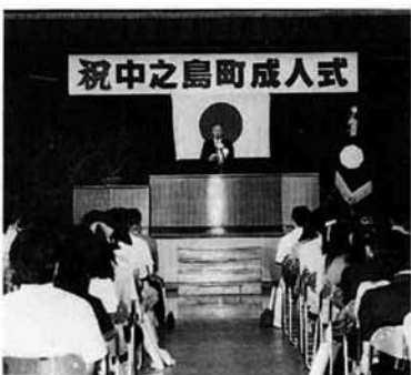
祝中之島町成人式

内中学校卒業者 ◇ 〓 〓 なお、出席者全員に記念品と記念写真を寄贈します。 詳しくは役場庶務課へお問い合わせ下さい。(☎〇二五八―六六―二〇二)