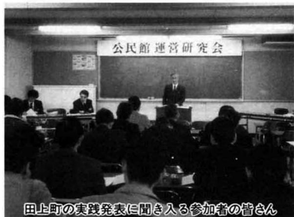
田上町の実践発表に聞き入る参加者の皆さん

二月十五日(日)、町公民館視聴覚室において中之島町公民館運営研究会が開催されました。