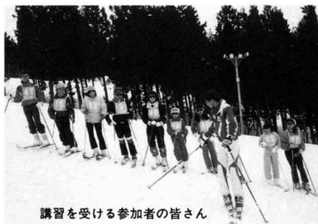
講習を受ける参加者の皆さん

二月四日(日)、町教育委員会と公民館の主催による親子スキー教室が、大和町の浦佐国際スキー場において行われました。