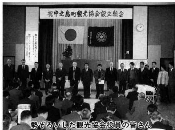
勢ぞろいした観光協会役員の皆さん

二月十九日、中之島町公民館講堂において中之島町観光協会の設立総会が行われました。