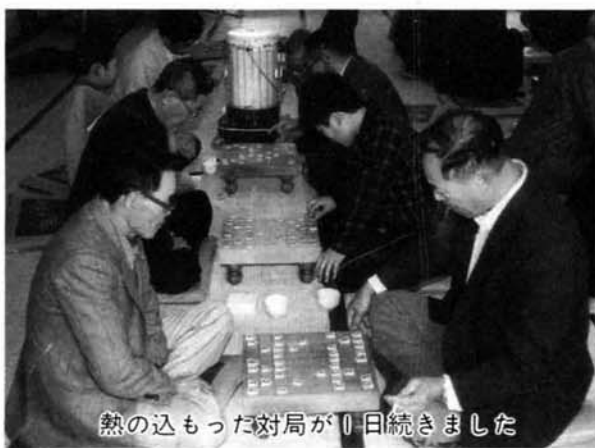
熱の込もった対局が1日続きました