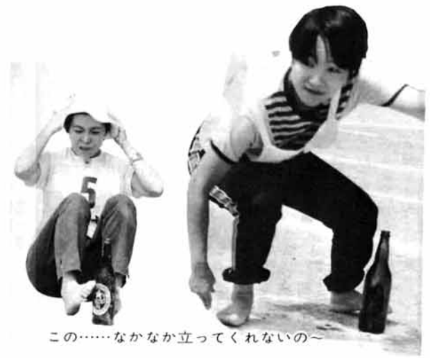
この……なかなか立ってこないの～

連日30度をこす真夏日、この日も 雲ひとつない春空から火の玉のよう に照りつける太陽、あふれる汗と砂 ホコリにまみれて競技をする人、「あ っちえーね」「あっちえーほうが いいがね、いい穂が出るれー」テ ントのなかで汗をふきふき応援するおやじ