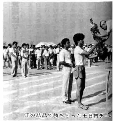
汗の結晶で勝ちとった七日市チーム

体育祭のスナップ写真を差し あげます。役場一階フロアーに ありますので、あなたの写った 写真、お隣りさん、友達のもの がありましたら、お持ち返りく ださい。(無料)