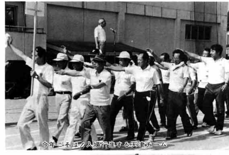
今年こそはノ入場行進する天津チーム