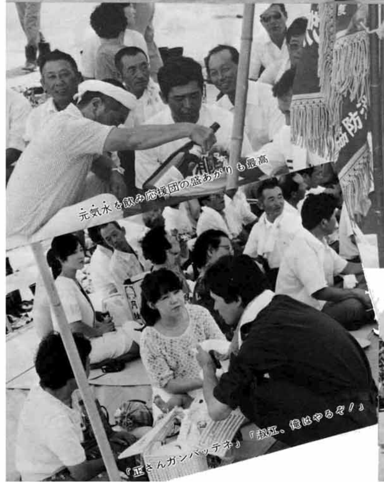
元気水を飲み応援団の盛り上がりも最高