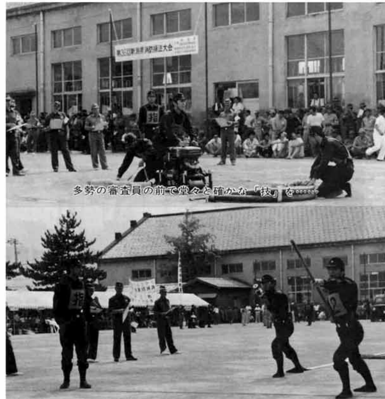
多勢の審査員の前で堂々と確かな「技」を

昭和60年8月15日 発行 新潟県三島郡三島町役場 ☎(0258) 442-2221 印刷 長岡市 総合印刷 KK中 越