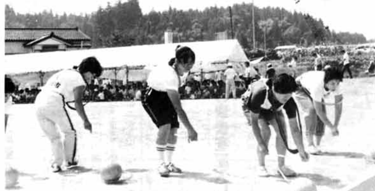
玉いじりは自信あるの～