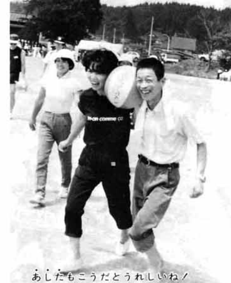
あしたもこうだとうれしいねノ