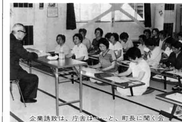
企業誘致は、庁舎は...と、町長に聞く会

グループ・同好会 婦人学級 より豊かな婦人へ 社会探歩 楽しく学び、より豊かな婦人になりましょう。 いろいろな地区の人と交流し合って、仲間意識を持ち、明るい家庭、豊かな町づくりをしましょう。こんな願いをもって婦人学級があることは、とてもご存じかと思えます。この学級は町在住のご婦人であれば、どなたでも気楽に参加できます。講座は昼の部と夜の部があり、回数は大休月一、二回です。今年度の学級生は七月現在、仕の部四十六名、夜の部六十五名です。年々、ご婦人達の学ぶ姿勢も、徐々に高まってきているようです。 夜の十時までに眠気がまわって、「家庭のあり方」についての