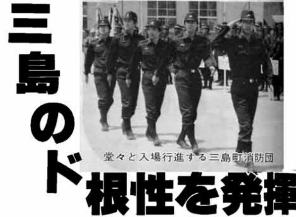
堂々と入場行進する三島町消防団