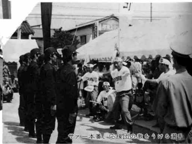
サー一本番、応援団の数をうける選手

グループ・同好会 婦人学級 より豊かな婦人へ 社会探歩 楽しく学び、より豊かな婦人になりましょう。 いろいろな地区の人と交流し合って、仲間意識を持ち、明るい家庭、豊かな町づくりをしましょう。こんな願いをもって婦人学級があることは、とてもご存じかと思えます。この学級は町在住のご婦人であれば、どなたでも気楽に参加できます。講座は昼の部と夜の部があり、回数は大休月一、二回です。今年度の学級生は七月現在、仕の部四十六名、夜の部六十五名です。年々、ご婦人達の学ぶ姿勢も、徐々に高まってきているようです。 夜の十時までに眠気がまわって、「家庭のあり方」についての