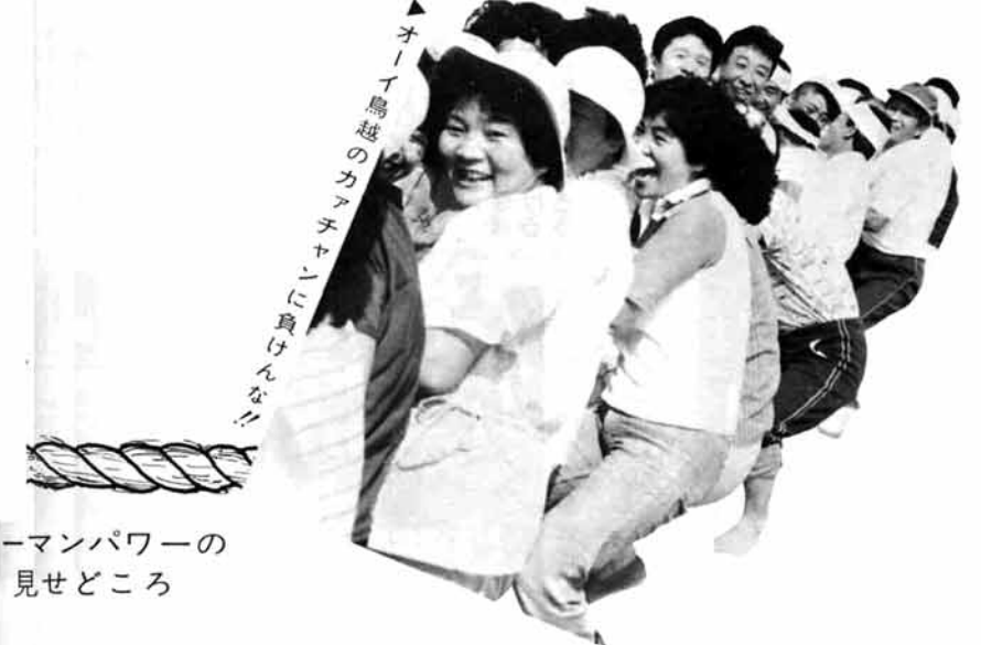
マンパワーの 見せどころ