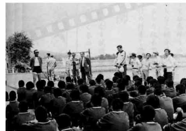
苗を植えるときは豊作を祈りながら真心をこめて…… 校長先生のお話

など持ったことがない、使えない子供が多いときます。また、スーパに行けば、真冬でもキウウリやトマト・スイカまであり子供達にとつて、野菜はいつ何が収穫期か、わからない環境のなかで、「人間が生きていくために絶対必要な食物をつくる」農業の大切さを理解できないのではないでしょうか？