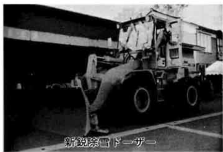
新鋭除雪ドーザー