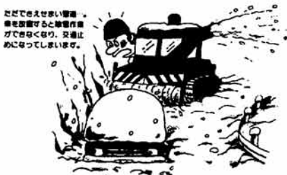
道路に雪が積もると車の通行が困難になります。また、凍結防止剤が道路に流れ出すと、車のタイヤが滑りやすくなります。